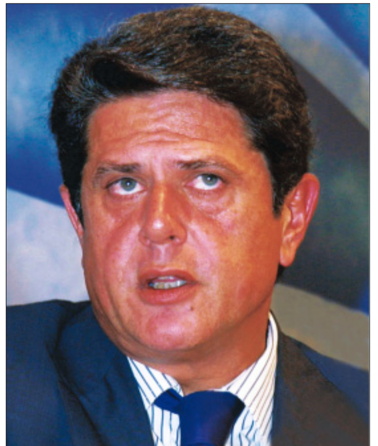
Federico Trillo, ex-ministro de Defensa

taría el actual director general de la guardia civil, Zaplana señaló: "Pues Federico Trillo tiene sin duda toda la información al respecto y si lo dijo yo no tengo la más mínima duda que tendrá argumentos para sostenerlo y mantenerlo y ser así. Pero lo que se trata en estos momentos es de valorar si efectivamente toda la política que sigue realizando el partido socialista, hoy vamos a hablar del 11M dentro de un rato en un debate también importante tiene que estar en un proceso de revisión de lo anterior, en un proceso de revisión permanente, sin haber encontrado nada están buscando permanentemente, están removiendo Roma con Santiago, todo su afán en su que hacer político diario es intentar criminalizar al que fue gobierno y hoy estamos en la oposición, y eso es malo para un sistema democrático".