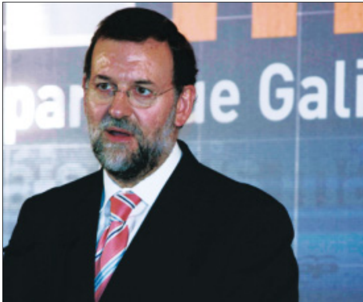
Rajoy exige al Ejecutivo que modifique su política contra ETA

Así las cosas, Rajoy ha pedido al Gobierno que recupere el espíritu del Pacto por las Libertades y ha asegurado que si el Ejecutivo vuelve a la política del Pacto, “a pesar de la enorme descon-