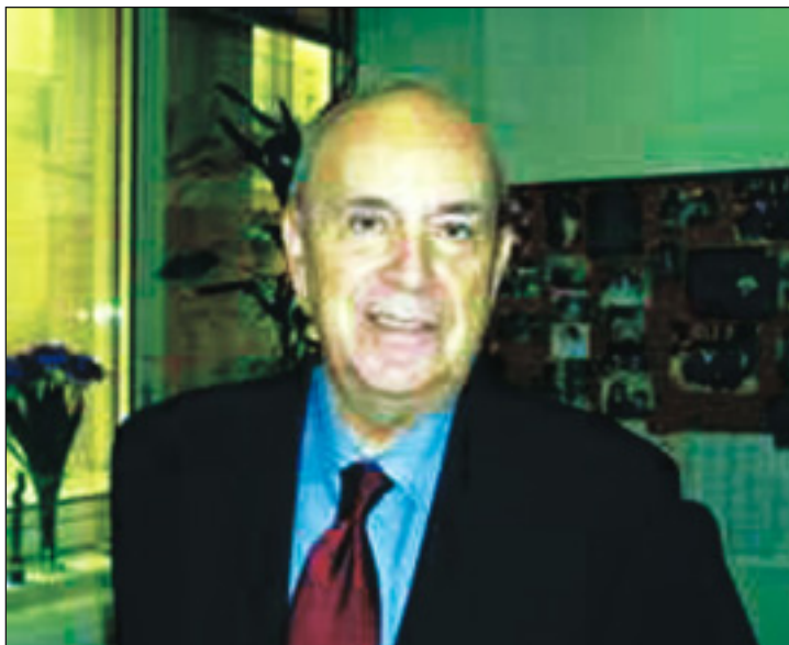
Alejandro Muñoz Alonso

El senador popular advirtió al titular de Exteriores de que esta política ideológica, que no tiene más norte que los intereses partidistas del socialismo gobernante, de sus líderes y de sus socios y compañeros de viaje, sólo tiene un único punto de llegada: el fra-