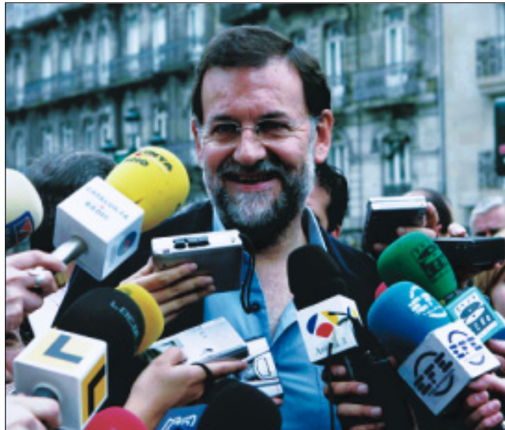
Rajoy asegura que Zapatero ha cometido una gran irresponsabilidad

El presidente del PP ha recordado además que el PP ha presentado un proyecto de ley "exactamente igual al que existe y ha sido aprobado en la inmensa mayoría de los países europeos, con-