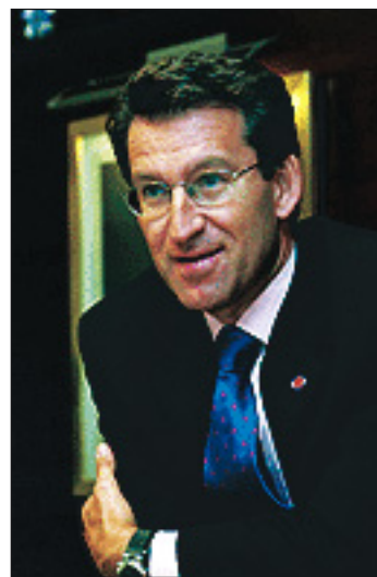
Alberto Núñez Feijóo

Hombre yo creo que las personas que marcan tiempos y que marcan un espacio en la historia de la transición española y en la historia de la autonomía gallega pues siempre son más difíciles suceder que otras. Hay otros líderes que su sucesión simplemente es sencillísima, porque no han sido realmente líderes que han confirmado opinión y que han conformado un estilo de hacer política, la sucesión del expresidente González pues no fue fácil para el partido socialista, recuerde todas aquellas cosas que ocurrieron hasta ganar un congre-