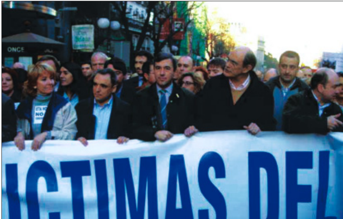
Manifestación en la que fueron detenidos ilegalmente los militantes del PP

La resolución judicial constata que “no se produjo agresión al ministro Bono por parte de los detenidos”, pero además, recalca Acebes, que fueron detenidos sin ningún tipo de pruebas, y que la documentación elaborada en sede policial fue manipulada y ocultada al juez. Por eso, ha calificado la actuación de “operación político policial de acoso y derribo contra el Partido Popular, absolutamente intolerable e