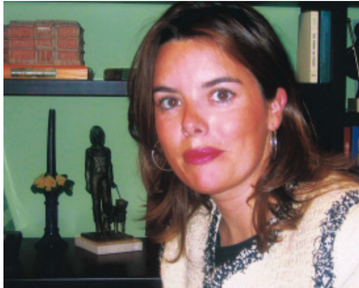
Soraya Sáenz de Santamaría

En este sentido, Sáenz de Santamaría ha afirmado que el Partido Popular hará uso de los mecanismos constitucionalmente pre-