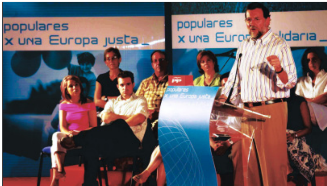
El presidente del PP habló en Toledo de las manifestaciones en defensa de la familia

En este sentido, el líder de los populares ha recordado que el PP presentó en el Congreso de los Diputados una ley de uniones de hecho, que tiene efectos jurídicos en el ámbito del derecho de familia y en el de los derechos de sucesión. Además, en aquella ocasión, ofreció al PSOE llegar a un acuerdo que fue rechazado por los socialistas, adoptando una decisión de “manera unilateral, dictatorial,