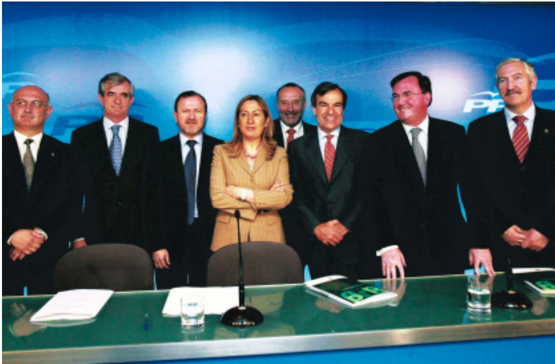
Ana Pastor, con los consejeros de Educación de las Comunidades gobernadas por el PP

Ana Pastor, en rueda de prensa junto con los consejeros de Educación de las Comunidades Autónomas gobernadas por el PP, calificó la memoria presentada por la ministra San Segundo como “las cuentas del gran capitán” porque se hacen “con el dinero de otros”. En este sentido, insistió en que de los 6.107 millones de euros anunciados para financiar la reforma educativa hasta el año 2010, el