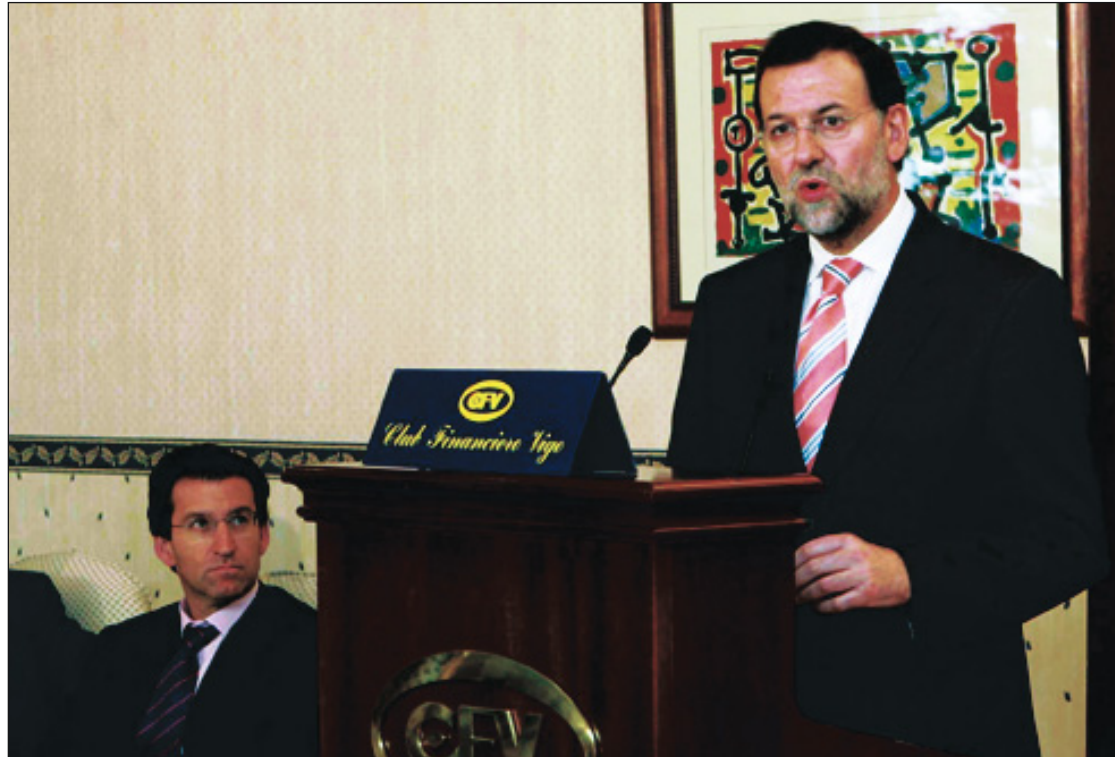
Mariano Rajoy asegura que el Gobierno genera división en la sociedad

El presidente de los populares ha explicado que "el PP no está en contra de los homosexuales sino en contra de que se llame matrimonio a algo a lo que nunca se ha llamado así y tampoco se le llama en ninguna parte del mun-