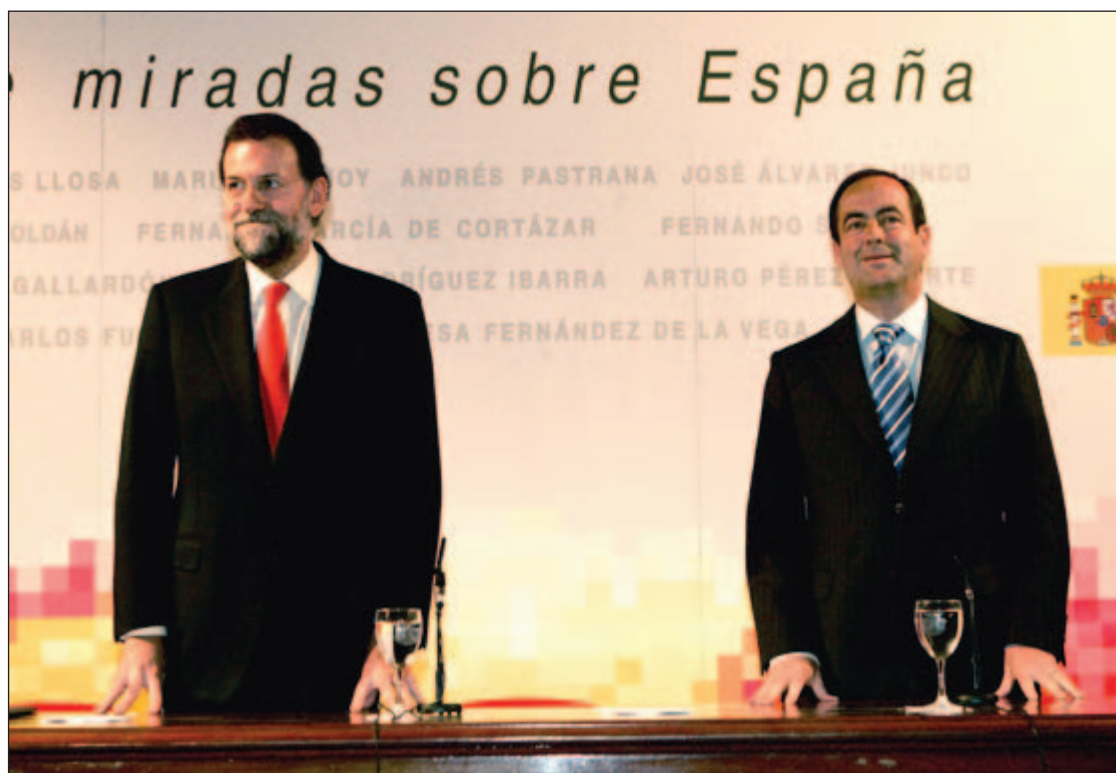
Mariano Rajoy, junto al ministro de Defensa, en el acto celebrado en Sevilla

Rajoy ha insistido en que este cambio de escenario ha sido provocado por una coyuntura que no se ha sabido o no se ha querido gestionar adecuadamente. “El partido gobernante ha llevado a cabo una arriesgada operación política