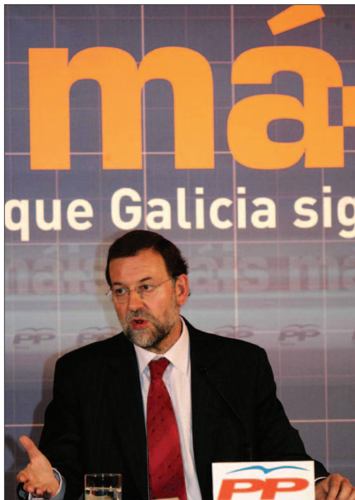
En la foto superior, un momento del Comité Ejecutivo celebrado en Vigo. Sobre estas líneas, Mariano Rajoy, en la rueda de prensa posterior

Rajoy advirtió que el PP no aceptará de ninguna manera que se pretenda aprobar la Constitución Europea por partes y que lo único que se convalide sea la parte que perjudica claramente a