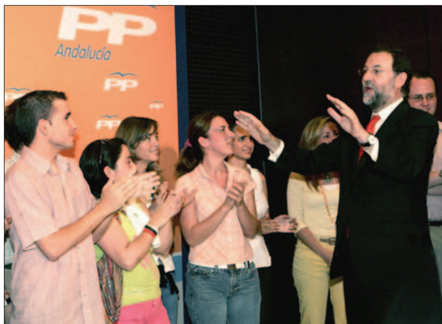
Mariano Rajoy, con Nuevas Generaciones de Andalucía