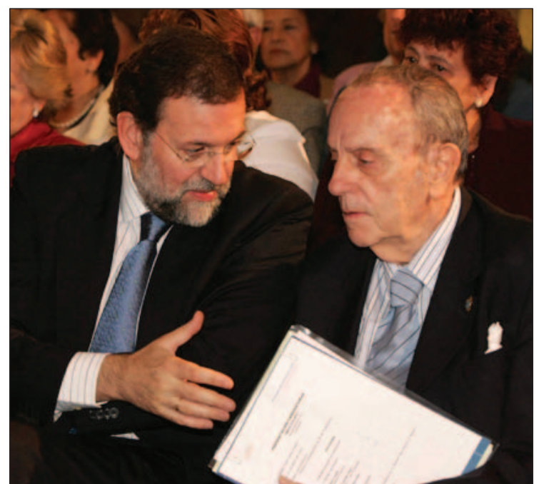
Rajoy conversa con Manuel Fraga en Pontevedra

Fraga apeló, además, a su experiencia y trayectoria política como aval para ganar estas elecciones y acusó a la oposición de “prometer” lo que “en su día criticaron”. “Algunos dicen que a Galicia le sobra cemento. Cemento haría falta para unirnos más”, recalcó el candidato popular, en alusión a los proyectos pendientes.