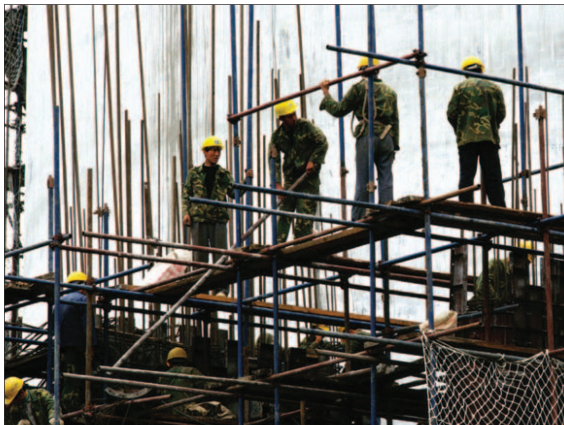
La política del Gobierno puede limitar la creación de empleo

los agentes económicos consumidores e inversores.