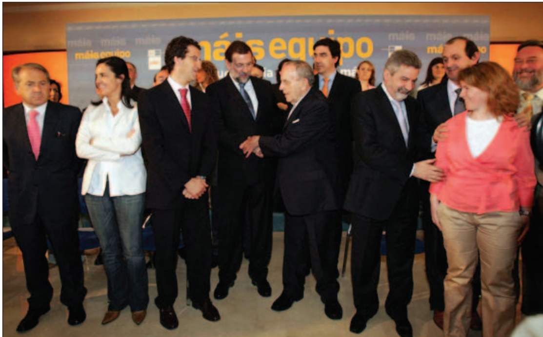
Mariano Rajoy, con los dirigentes del PP de Galicia

El presidente del PP aseguró que eso es lo que algunos quieren para Galicia. “Quieren convertir a Galicia en una pieza más del disparatado tablero en el que se ha convertido la política nacional por obra y gracia de Zapatero, Maragall y Carod, que ayer hizo la última, que sin duda alguna