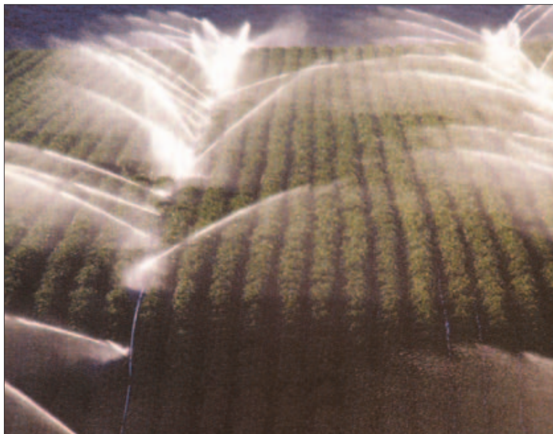
El PP considera que es necesario impulsar mejoras en el sector agrario

- Incremento de los techos CESCE en los países de mayor interés comercial y creación de un instrumento, a través de las