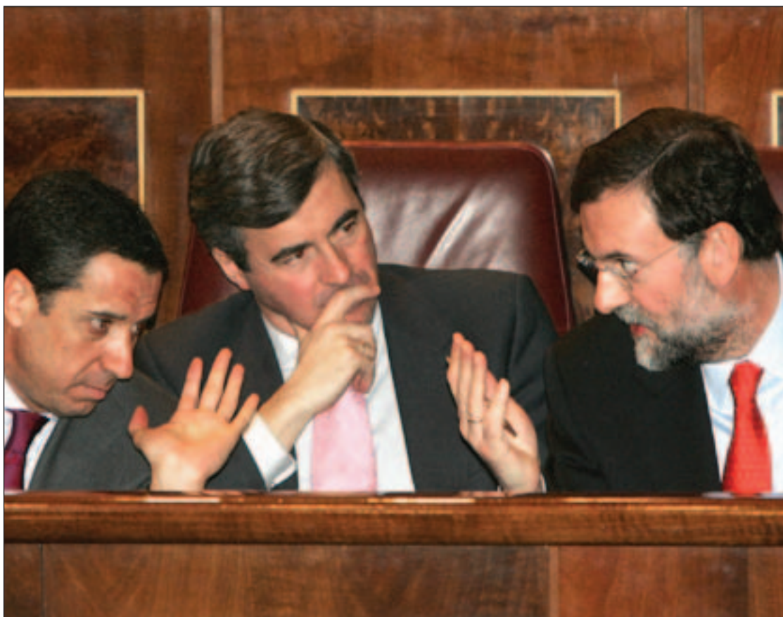
Zaplana, Acebes y Rajoy, en un momento del Debate

Desde luego, por apartarnos de ningún tipo de negociación con la banda.