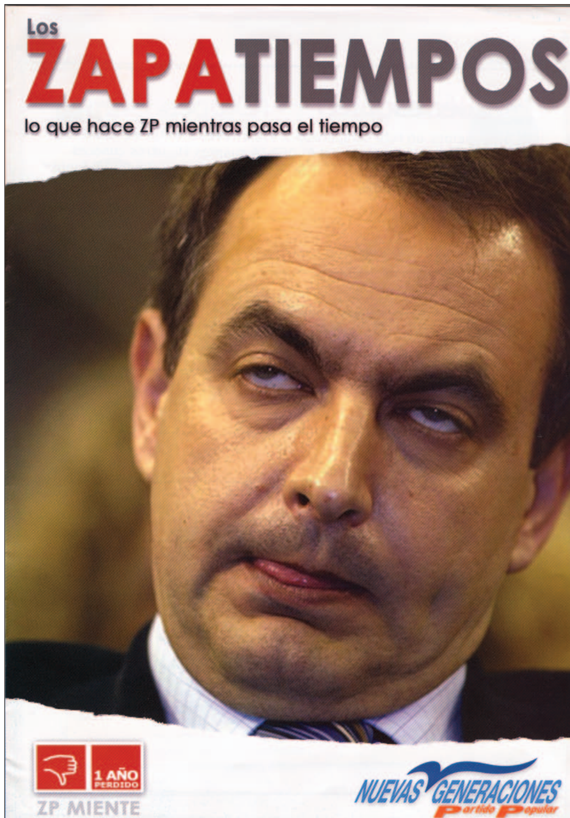
Portada del folleto editado por Nuevas Generaciones del PP

Fúnez ha arremetido además contra la política del Ejecutivo en materia de vivienda, cuyo ministerio no ha logrado solventar las dificultades de acceso de los jóvenes. Así, ha hecho alusión a la promesa incumplida de Trujillo de construir 180.000 viviendas y