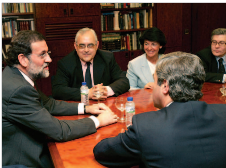
Rajoy y Acebes recibieron en la sede del PP al Foro de Ermua