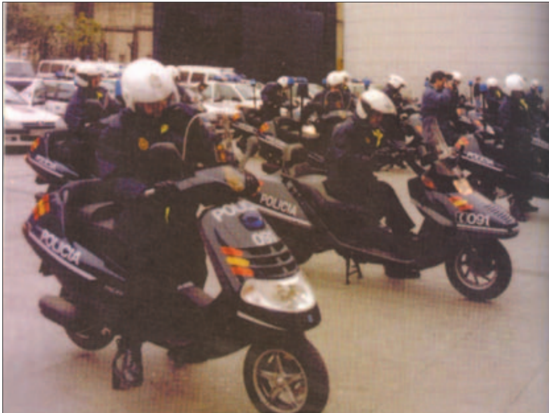
El PP propone incrementar los medios materiales y personales de las Fuerzas de Seguridad

El año 2002 fue pues el año de la desaceleración en el crecimiento de la delincuencia. El año 2003 comenzó con un frenazo total en el aumento y un inicio del descenso de la criminalidad. En el 2004 se ha continuado en esta misma línea en