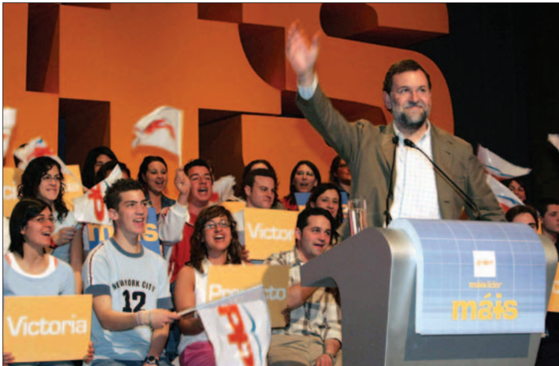
Mariano Rajoy, en una de sus intervenciones en la campaña de las elecciones gallegas

Durante un acto organizado para celebrar los dos años de gobierno del PP en la Comunidad Valenciana, Rajoy ha reiterado que el PP no