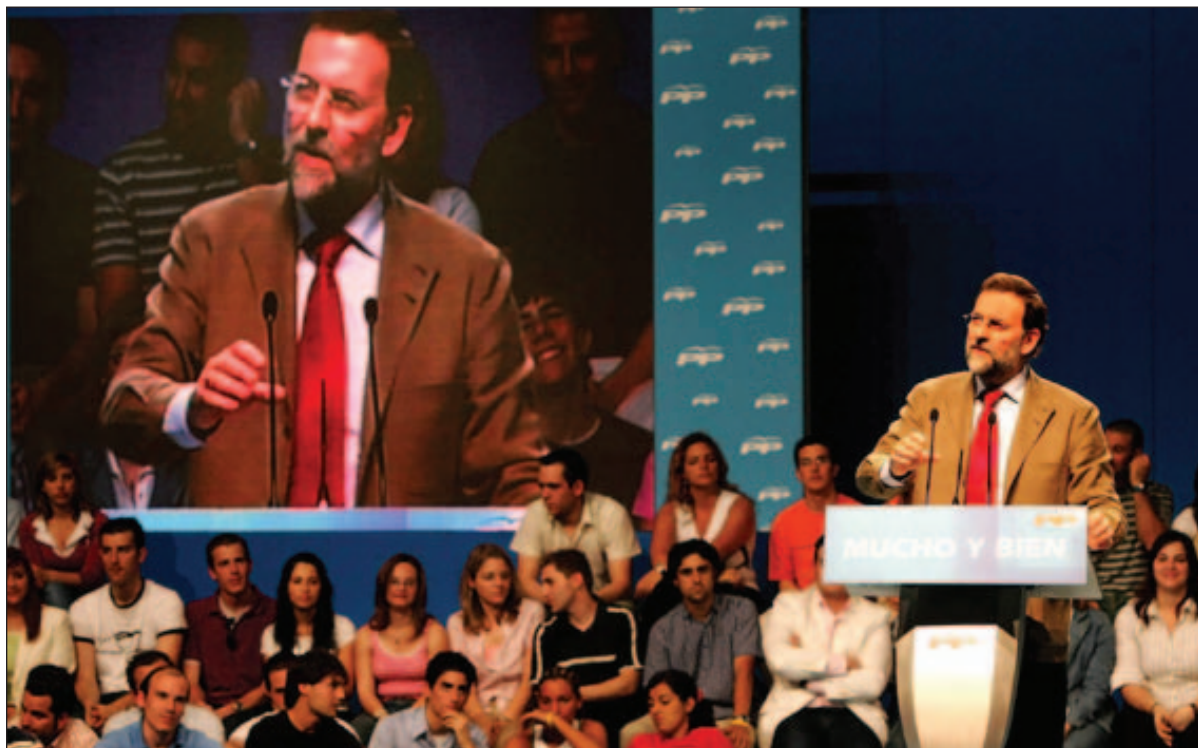
Mariano Rajoy, con jóvenes de Nuevas Generaciones, en un acto en Valencia