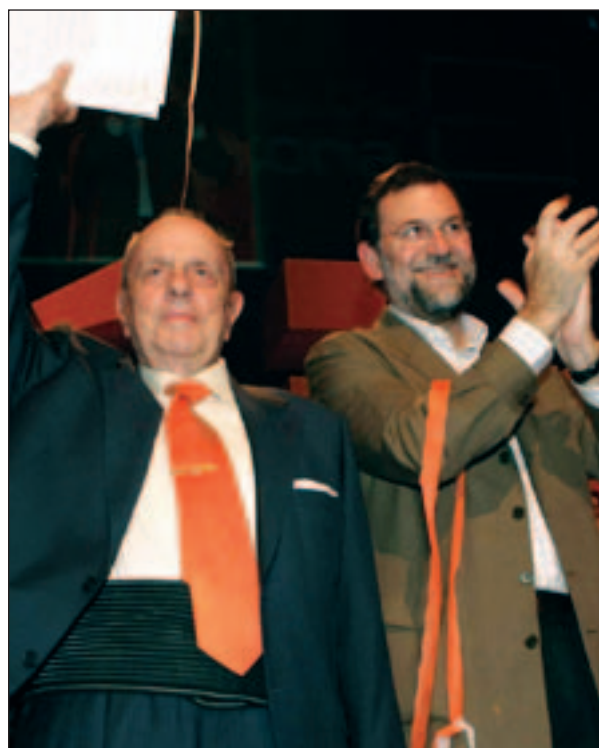
Fraga y Rajoy, en los primeros actos de precampaña