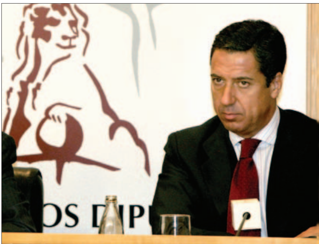
Eduardo Zaplana, en una intervención en el Congreso de los Diputados

El Partido Popular, además se ha ofrecido no sólo a mantener lo que dábamos ingenuamente por garantizado, sino también a ampliar los espacios de acuerdo en beneficio de todos los españoles.