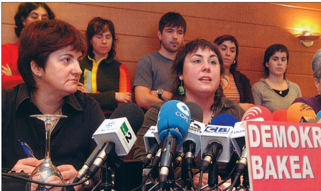
Miembros del PCTV en una rueda de prensa

Fruto de este pacto fue la Ley Orgánica 6/2002, de 27 de junio, de Partidos Políticos, aprobada por las Cortes Generales con el apoyo de más de un 90% de las dos Cámaras, que ha venido a garantizar el funcionamiento del sistema democrático y las libertades esenciales de los ciudadanos, impidiendo que un partido político actúe en connivencia con la violencia y las actividades de bandas terroristas.