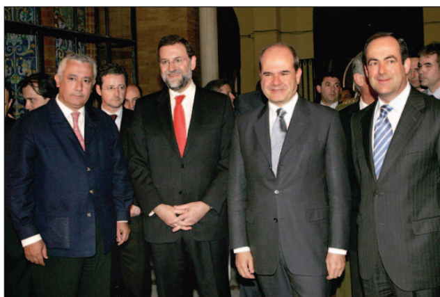
Rajoy, en Sevilla, con Arenas, Cháves y Bono