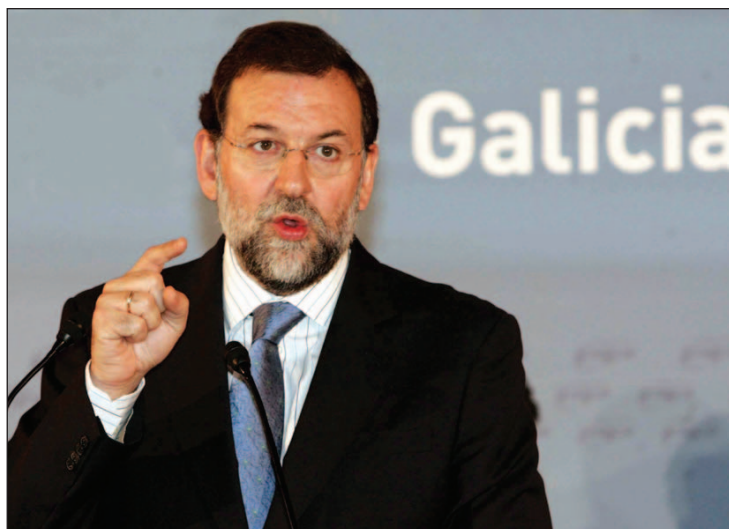
El presidente del PP expresó su preocupación por la política del Gobierno

"¿Qué va a hacer el Gobierno? No lo sé. Otegi le ha recomendado que no trate con el PP, si el Gobier-