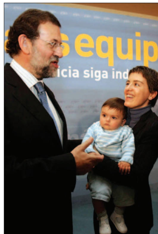
El presidente del PP, en Pontevedra