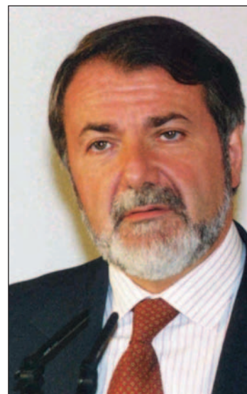
Jaime Mayor Oreja

"Aunque los gobiernos de los Estados miembros tienen la competencia de decidir las medidas de inmigración, los casos de Alemania y España son ejemplos claros de cómo las medidas unilaterales adoptadas por gobiernos nacionales pueden debilitar y fragmentar el Espacio Europeo de Libertad, Seguridad y Justicia que estamos construyendo, como ha declarado recientemente la propia Comisión Europea", afirmó el