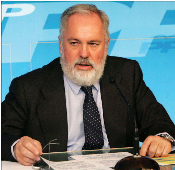
Miguel Arias Cañete, responsable de Economía del PP

Por otro lado, el Ejecutivo debe ser consciente que el nuevo dato de crecimiento, que lo sitúa en el 3,1%, “habría sido dos décimas inferior si se hubiera mantenido la metodología de base fija que teníamos hasta ahora”. De esta forma, el Gobierno no debería apuntarse un crecimiento meramente estadístico cuando la nueva contabilidad nos dice que la inversión en bienes de equipo no ha ido tan bien como lo que se estaba anunciando hasta ahora”.