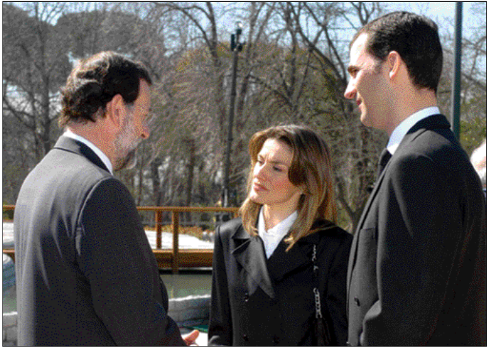
Rajoy, con los Príncipes de Asturias