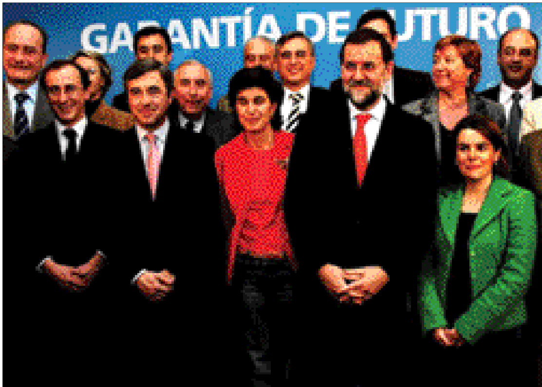
Mariano Rajoy, en Vitoria, junto a otros dirigentes del PP

Durante las últimas décadas, los Ayuntamientos han desarrollado un trabajo constante y leal, supliendo muchas veces la falta de presencia del Estado y de las CC.AA., y asu-