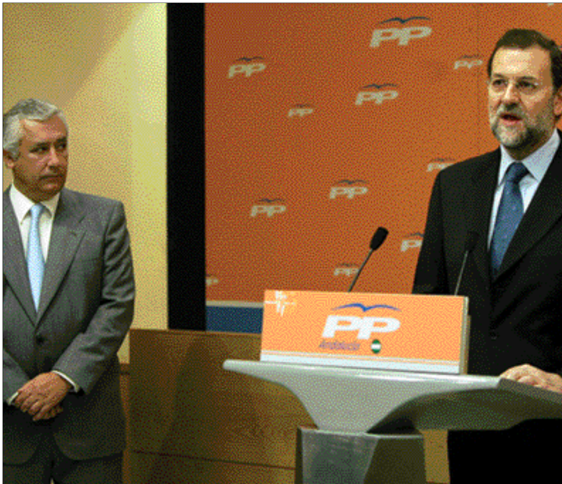
El presidente del PP lee su declaración Institucional en presencia de Javier Arenas

Las víctimas del 11 de marzo se suman a los muchos centenares de españoles que les han precedido en el padecimiento y nos recuerdan que, para nosotros, no hay matices en el dolor, del mismo modo que no reconocemos diferencias en el terror. No importa quién lo utilice. No importa cómo pretendan justificarlo. No importa qué