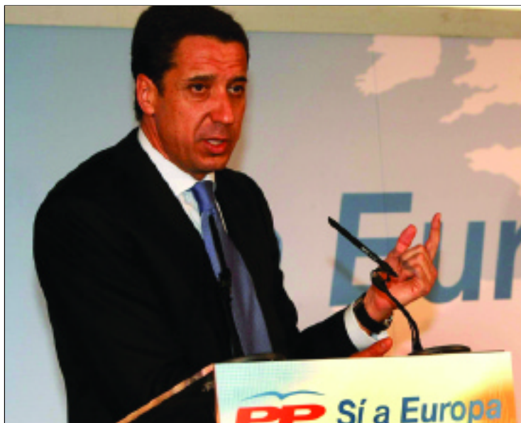
Eduardo Zaplana, portavoz del PP en el Congreso

Con este objeto, anunció que se pondrá en contacto con el presiden-