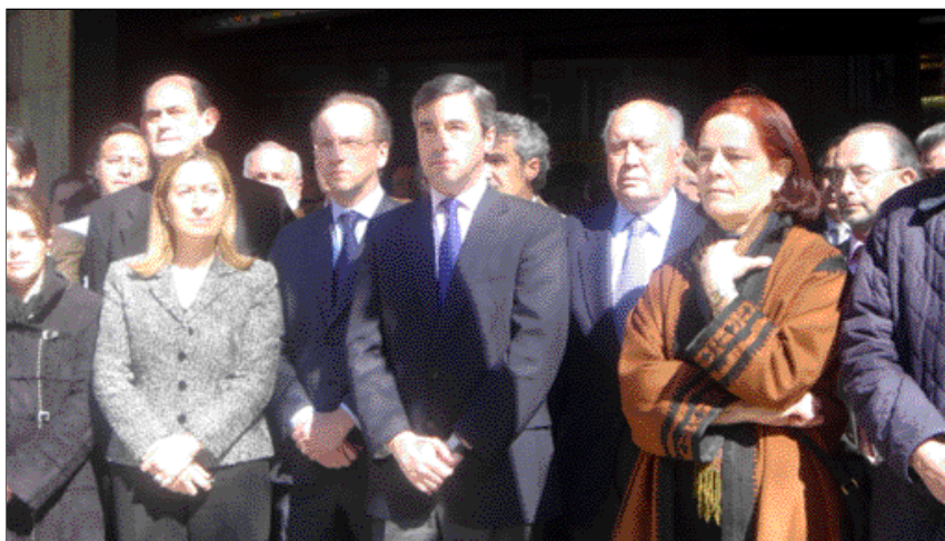
Concentración en la sede del PP en el aniversario del 11-M