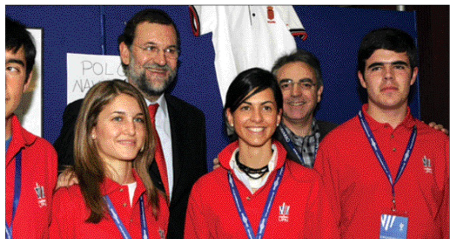
Rajoy, con los jóvenes de la Unión del Pueblo Navarro