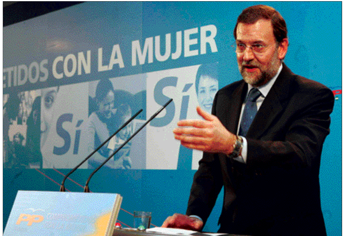
Mariano Rajoy, en un acto reciente sobre la mujer

Todo ello, según ha advertido, pone de manifiesto la falta de ideas del presidente del Gobierno sobre España, y sobre qué reformas quiere introducir en la Constitución y los Estatutos. Algo similar a lo que es-