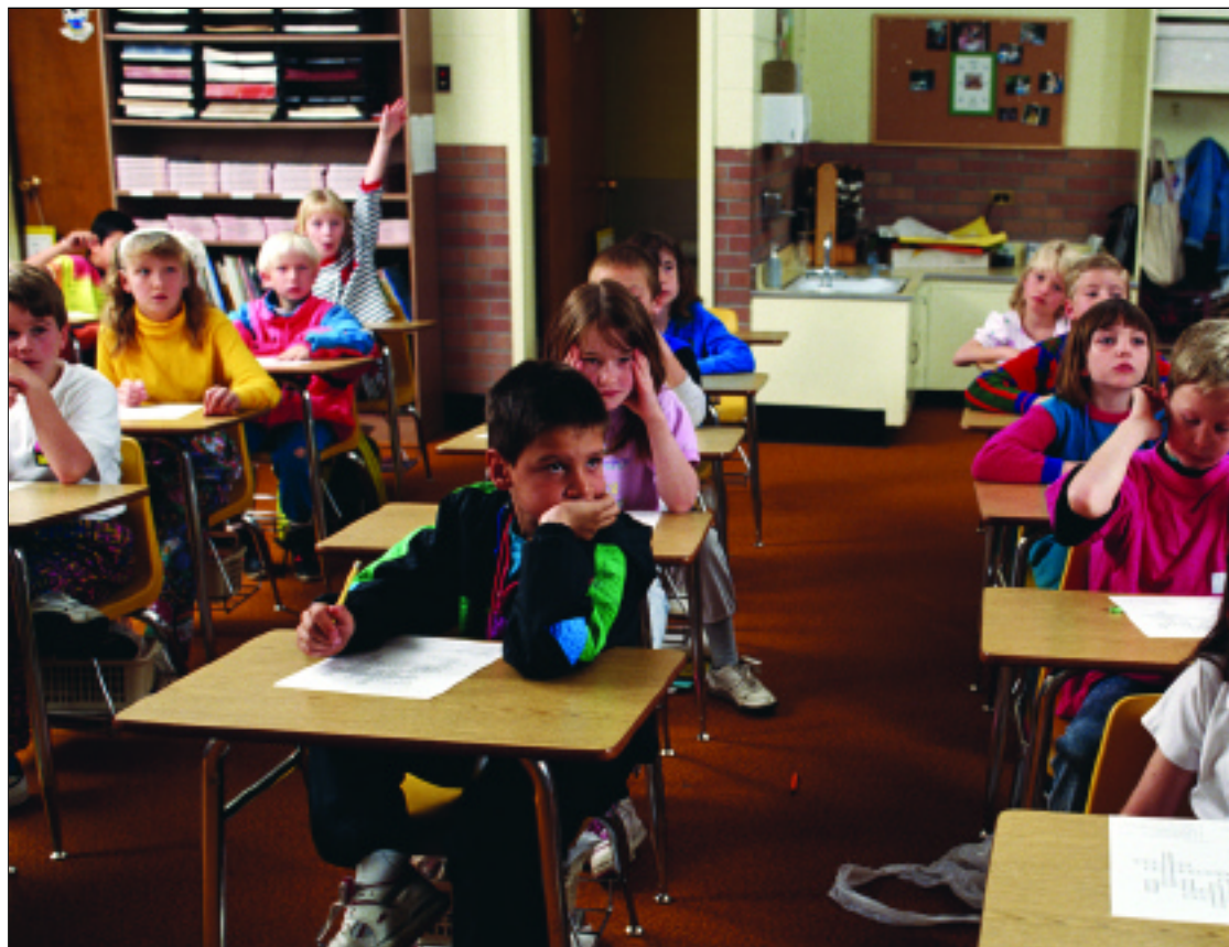
El proyecto del Gobierno no resuelve las dificultades de aprendizaje de los alumnos

Pastor ha lamentado además la falta de propuestas del Ejecutivo en torno a la educación infantil, para