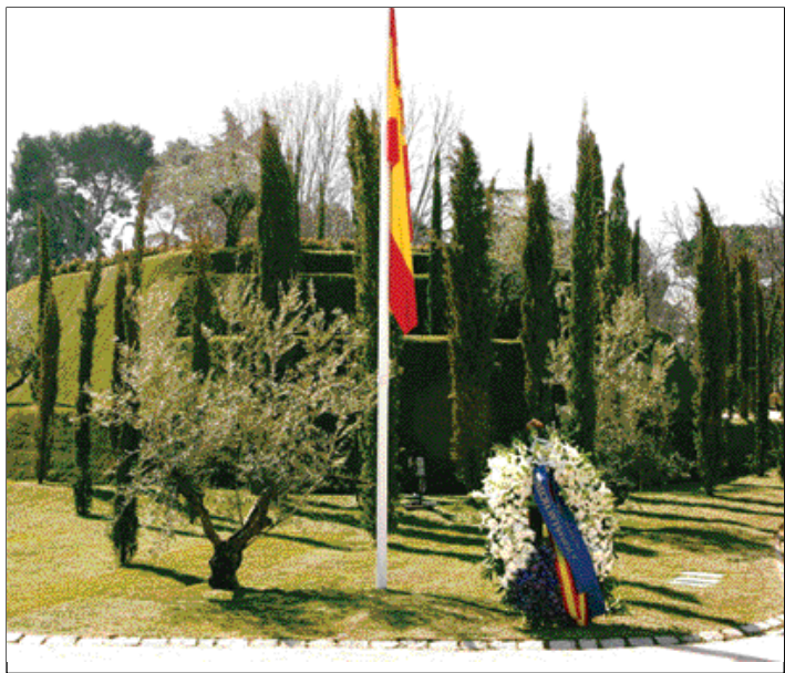
El Bosque de los Ausentes, el 11-M