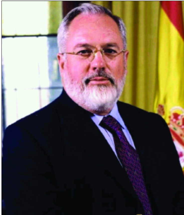
Miguel Arias Cañete

Además, el Gobierno sigue sin transponer cinco directivas pendientes, a lo que se une que la mejora del marco institucional de defensa de la competencia está ausente y no se han adoptado medidas de fomento para el apoyo al comercio exterior.