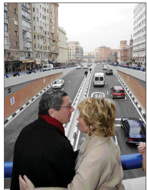
Ruíz-Gallardón y Esperanza Aguirre