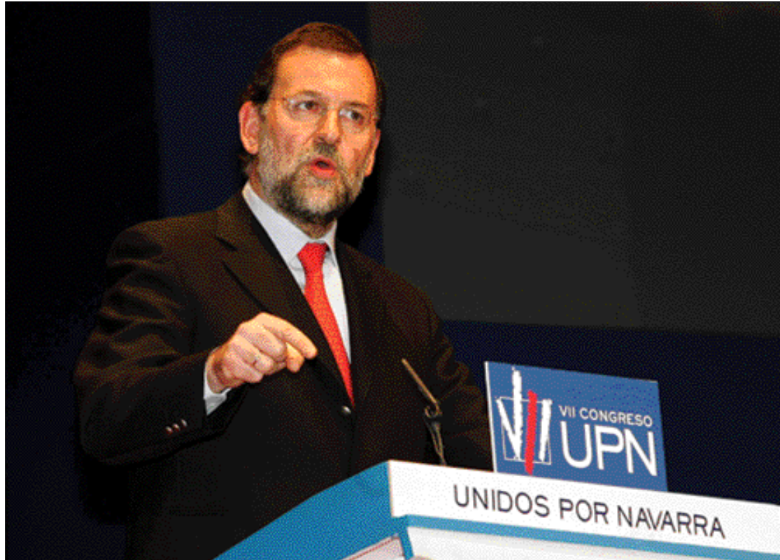
Mariano Rajoy asistió al Congreso de UPN

Por otro lado, Rajoy ha definido de "error monstruoso" la venta de armas por parte del Gobier-