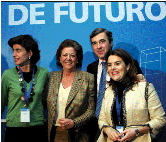
María San Gil, Rita Barberá, Acebes y Soraya Sáenz