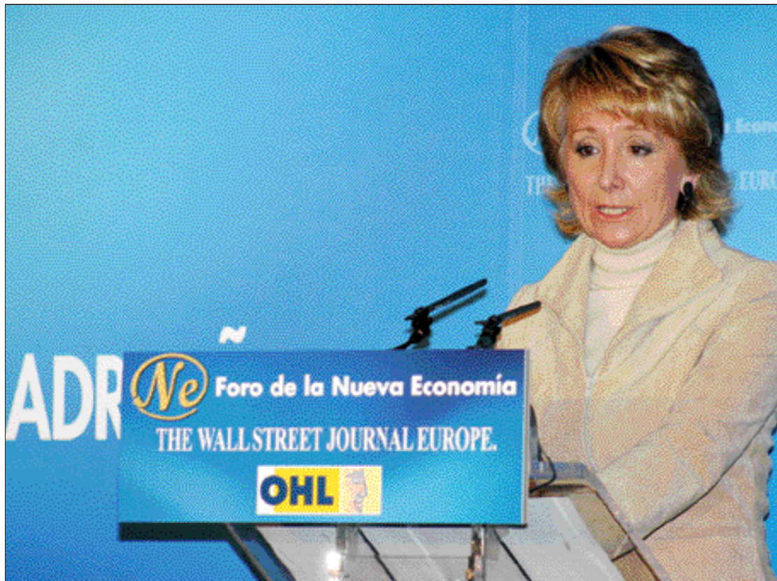
Esperanza Aguirre denunció el castigo al que Zapatero somete a los madrileños

Respecto al crecimiento económico de la Comunidad de Madrid, Esperanza Aguirre señaló que des-