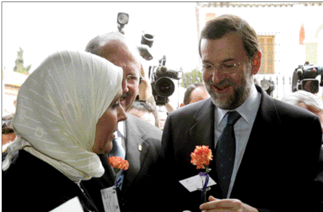
Rajoy, en el acto sobre la mujer organizado por el PP