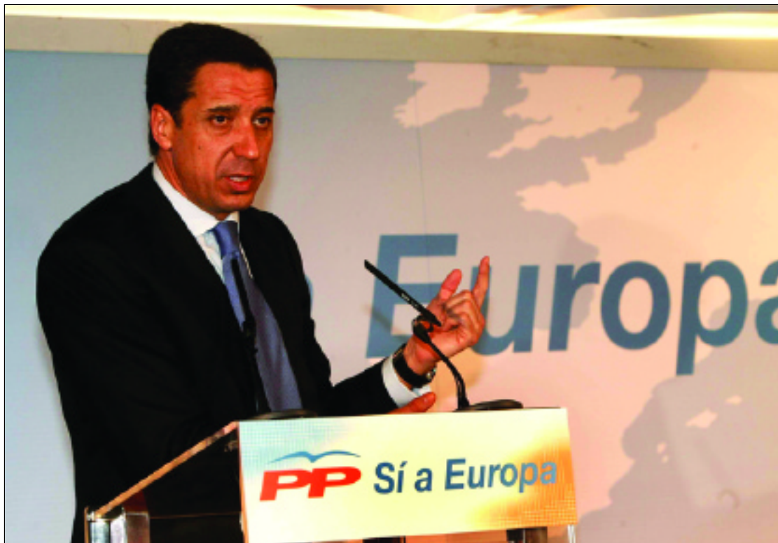
Eduardo Zaplana explicó el recurso presentado por el PP

"En relación con los artículos 2, 4, 13 y Anexo I nos encontramos ante una situación en la que no se puede considerar producida la aprobación por el Congreso de los Diputados de todos los gastos e ingresos del sector público estatal, pues el procedimiento de formación y expresión de la voluntad de la Cámara no se ha acomodado a la constitución ni al Reglamento parlamentario ni, en consecuencia, se ha ga-