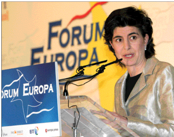
María San Gil, candidata a Lehendakari

"El cambio que nosotros garantizamos pasa inevitablemente por que el nacionalismo e Ibarretxe pasen a la oposición. Después de 25 años de poder hegemónico nacionalista, tenemos la sociedad más