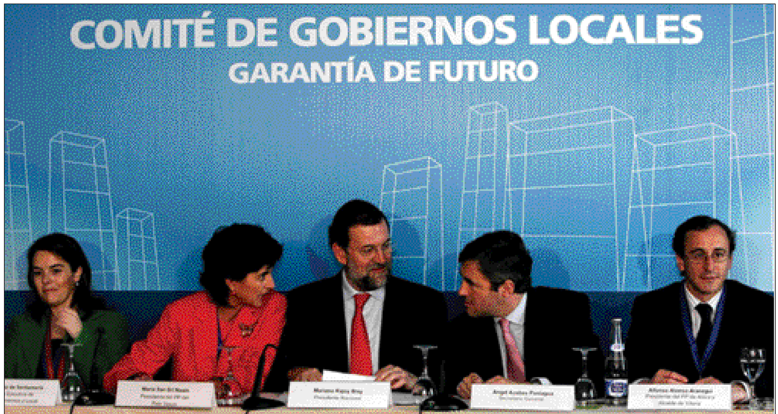
Soraya Sáenz, María San Gil, Mariano Rajoy, Ángel Acebes y Alfonso Alonso

Los Ayuntamientos gobernados por el Partido Popular mostramos nuestra preocupación por la forma en que el Gobierno está gestionando, la regularización extraordinaria de inmigrantes, llamada normalización por el Gobierno, en virtud