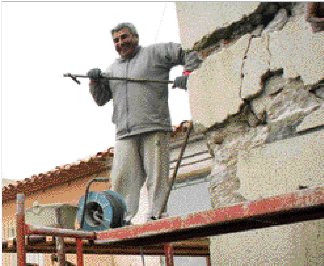
El PP ha propuesto un Plan para la rehabilitación de las viviendas afectadas

La moción del PP, exige también al Ejecutivo que declare zona ca-