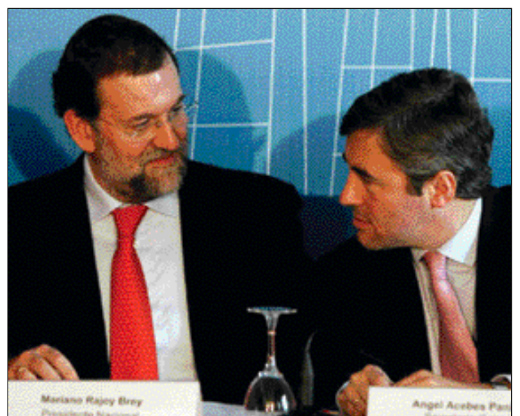
Mariano Rajoy, junto al secretario general del PP

Asimismo, Mariano Rajoy ha vuelto a criticar las declaraciones del presidente del Consejo de Estado, Francisco Rubio Llorente, a favor de la sustitución del término "nacionalidad" por "comunidad nacional", al considerar que son una "patochada", al tiempo que ha lamentado la indefinición del presidente del Gobierno en torno a las reformas constitucionales y estatutarias. Para el líder del PP, este tipo de debates están generando problemas donde no los hay, al tratarse de temas que no constituyen motivo alguno de preocupación para la ciudadanía. "Estos señores están creando problemas donde no los hay. Han creado un problema monu-