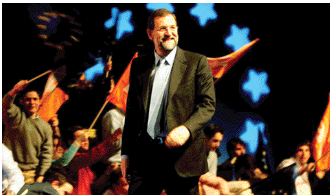
Mariano Rajoy, en uno de los actos de la Campaña sobre el Referéndum