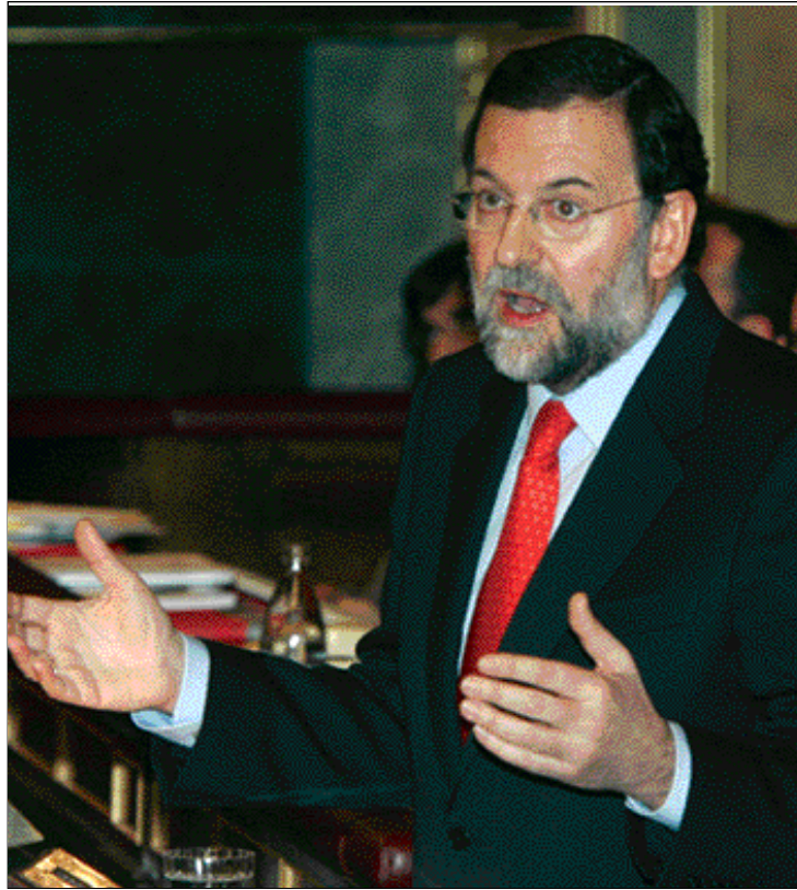
Mariano Rajoy, dirigiéndose al lehendakari Ibarretxe

Señor Ibarretxe, ¿en nombre de qué derechos históricos habla usted? Porque si las palabras quieren decir lo que se supone que quieren decir, derechos históricos son derechos que tiene usted en base a la historia. ¿Puede usted explicarme cuándo ha habido una comunidad vasca unificada e independiente? ¿Puede usted explicármelo? Señor Ibarretxe, si esta Cámara no acepta la libre asociación que usted nos propone, ¿es obligatoria? Si usted la aprueba, la somete a referéndum y la gana, ¿es obligatoria? ¿Podemos opinar? ¿Podemos decir que estamos de acuerdo o que no estamos de acuerdo? Usted se ha creído que usted es la ley y esto es pre-