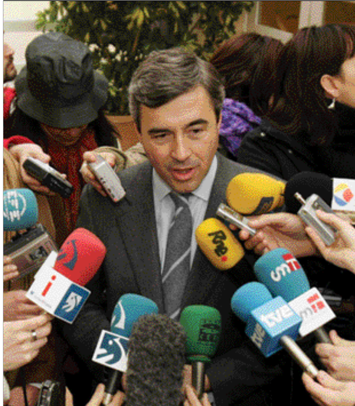
Ángel Acebes, en la reciente campaña del referéndum

tido Popular se plantea una campaña electoral con un proyecto abierto y cuyo eje fundamental será un mensaje de defensa de la Constitución y del Estatuto de Guernica, como punto de encuentro y de prosperidad del País Vasco. "Nuestra oferta es mantener el sentido común, no abandonar las posiciones del estado constitucional para correr a ninguna parte, poner cordura frente a la locura secesionista y abrir los brazos a todos los vascos que, estando orgullosos de serlo, no necesitan buscar un enemigo".