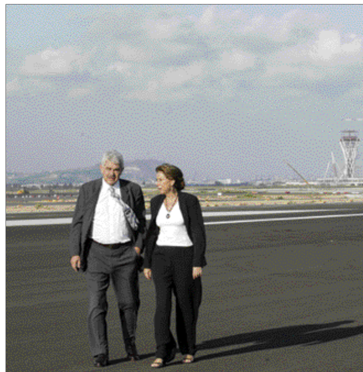
La Ministra de Fomento, en el Aeropuerto de El Prat

El Grupo Popular denuncia también que el Plan socialista no señala que pasa a partir del 2007, con la aplicación de los fondos europeos en el próximo marco comunitario 2007-2013. "Y no tener garantías