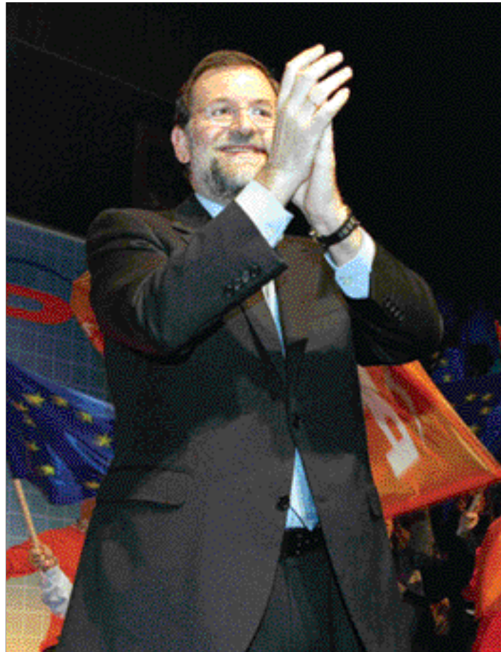
Rajoy, en el acto de cierre de campaña

En este sentido, Mariano Rajoy ha asegurado que Zapatero "se equivocó" en el procedimiento que utilizó para convocar este referéndum, tal y como refleja la prensa internacional, donde los editoriales son "preocupantes". En este punto explicó que uno de los periódicos más importantes del Reino Unido afirmó que la baja participación puede