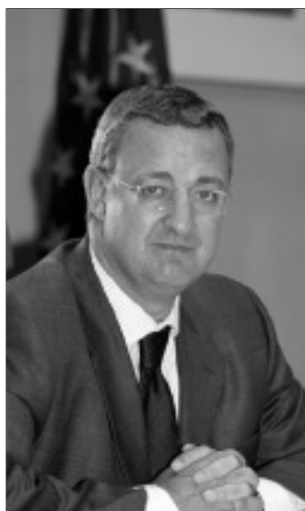
Jesús Caldera, Ministro de Trabajo

Por otro lado, el Partido Popular cree que “la evolución del desempleo de mujeres y sobre todo en jóvenes es muy negativa, sobre todo en el caso de los jóvenes ya que los datos de la EPA también han confirmado un comportamiento desfavorable ante el que el Gobierno no parece que reaccione con las urgentes y necesarias reformas”. Para Miguel Arias, “como la cifra de contratos registrada por el INEM ha disminuido sus-