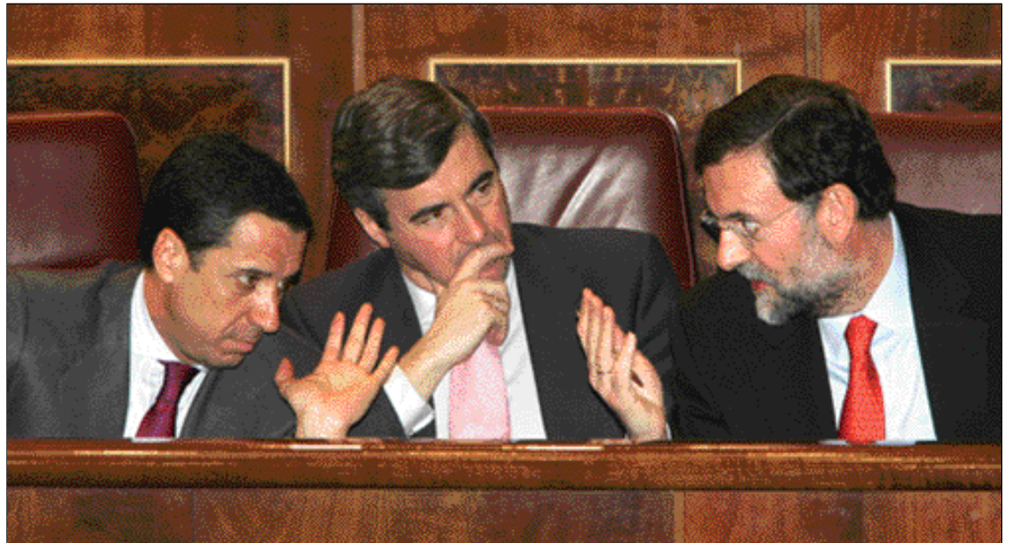
Rajoy, junto a Acebes y Zaplana, en un momento del debate

"Recibimos un documento que equivale a una declaración de independencia y yo me pregunto: ¿Cuál es nuestro papel? ¿Se nos informa? ¿Se nos consulta? ¿Se nos amenaza? No lo sé", indicó. En este sentido, Rajoy destacó que ya se ha anunciado el propósito de convertirlo en hecho consumado y convocar un referéndum ilegal. "¿Qué clase de farsa es esta? Pretender que tomemos en consideración algo que ya se ha determinado llevar a cabo en cualquier caso, sólo se puede calificar de desfachatez", afirmó.