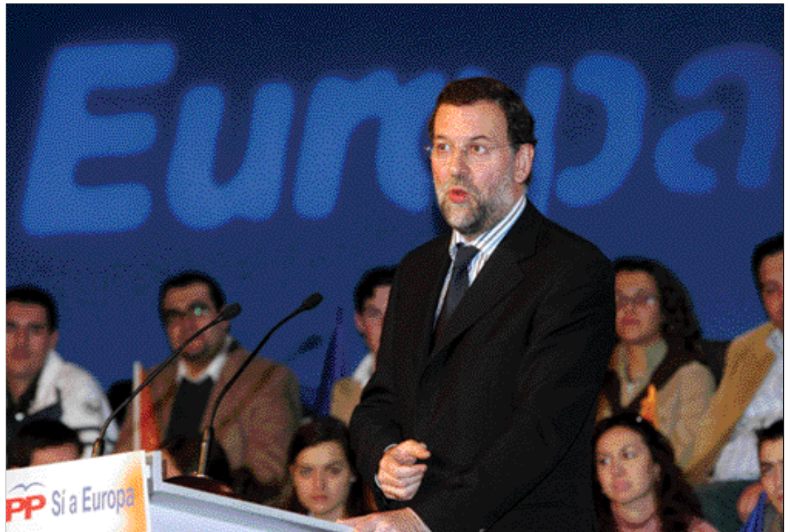
Mariano Rajoy, en un momento de su discurso

Por último, el líder del PP ha asegurado que a un terrorista sólo se le puede mandar un mensaje: que tiene que dejar de ser terrorista y que no se le va a dar nada a cambio. Todo lo demás es equivocarnos y es muy negativo si queremos acabar con el principal problema que tiene España, que es el terrorismo, que afecta a la vida, a los derechos y libertades de las personas", ha concluido.