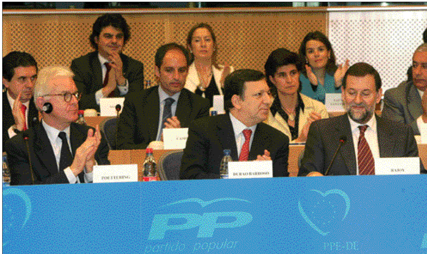
Mariano Rajoy y Dura Barroso, con otros dirigentes del PPE, en la reunión celebrada en Bruselas

El principio siempre ha sido el mismo: acelerar la convergencia real de las economías europeas a través de grandes inversiones en los territorios menos desarrollados de la Unión, a la vez que se crea un mercado interior cada vez más amplio, que produjera beneficios en las dos direcciones.