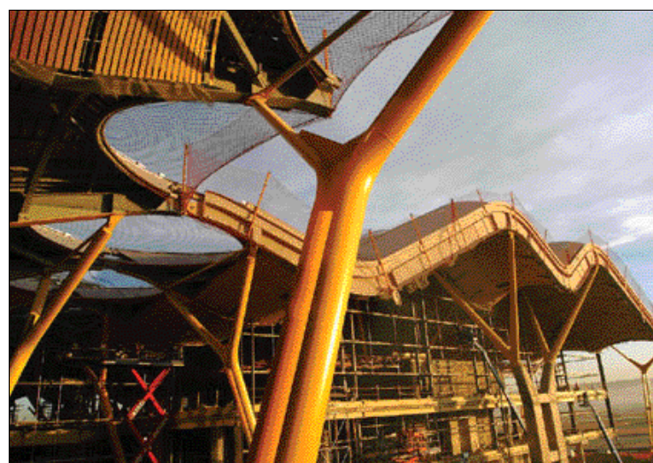
Nuevo edificio Terminal de Barajas, aún fuera de servicio

En una segunda fase incluida ya en el Plan de Infraestructuras 2000-2007 que puso en marcha el Ministerio de Fomento se dota al aeropuerto durante el año 2004 de dos nuevas pistas de 3.500 metros y una Nueva Área Terminal (NAT) formada por un edificio terminal principal, un dique para vuelos nacionales y Schengen más un edificio satélite para vuelos internacionales así como un edificio para aparcamiento de vehículos. Estas nuevas instalaciones permiten el procesamiento de 10.400 pasajeros por hora punta y un diseño que permitirá que un 50% de las operaciones totales sean conexiones, además de la instalación de un sistema de tratamiento automático de equipajes y un tren automático de transporte de pasajeros pa-