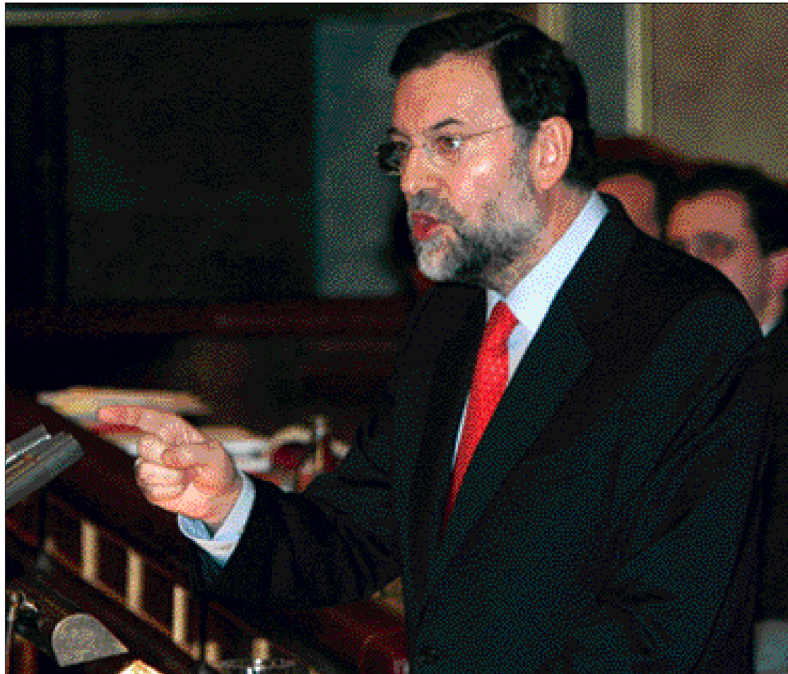
El presidente del PP, durante su intervención en el Congreso de los Diputados

En el debate sobre la propuesta de Estatuto Político para el País Vasco, Rajoy alegó que en España la única soberanía reside en el conjunto de los españoles y se expresa a través de las urnas. "Estoy recordando algo que es obvio aunque algunos hagan como que no oyen: el País Vasco no es patrimonio privado de nadie. Todos los españoles tienen derecho a decidir sobre su presente y sobre su futuro, del mismo modo que todos los españoles, incluidos los vascos, tienen derecho a decidir