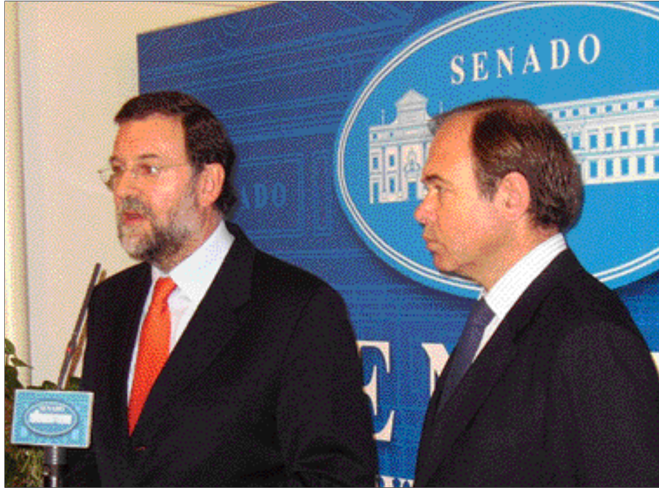
Rajoy, con el portavoz del PP en el Senado, Pío García-Escudero

Las seis cuestiones a las que se ha referido Rajoy tienen en común, según el líder del PP, que afectan a asuntos de la máxima importancia desde el punto de vista del modelo territorial, y que sobre ellas se han pronunciado diversos miembros del Gobierno o los socios parlamentarios de éste, sembrando incógnitas que el Ejecutivo tiene que aclarar. En concreto, Rajoy se ha referido a la financiación de las Comunidades Autónomas, cuyo modelo actual se pactó de forma