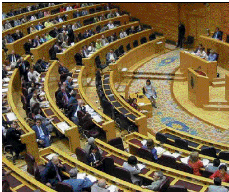
Un momento del Pleno del Senado

Abejón ha insistido en que estas medidas se lleven a cabo con urgencia porque "no debemos permitir que el curso próximo sea otro curso perdido". También ha reiterado que la financiación de la Educación Infantil es un compromiso