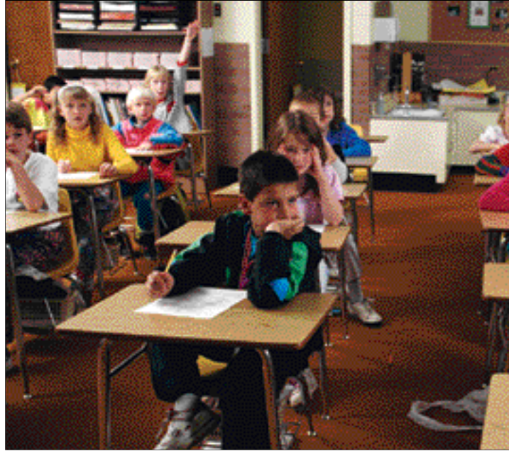
A juicio del PP, el Ejecutivo atenta contra el derecho a la educación

Para ello, se ha puesto como ejemplo las miles de firmas de padres conseguidas por organizaciones que no quieren que se modifi-