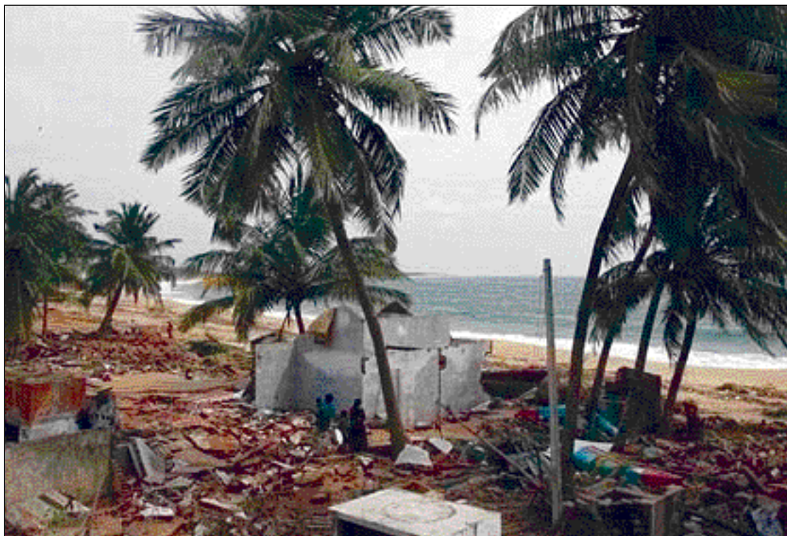
El PP quiere conocer las ayudas que el Gobierno va a destinar al sudeste asiático

Para los populares no es posible abordar una estrategia a medio y largo plazo desde el punto de vista presupuestario y material si no se dispone sobre el terreno de dicha ofi-