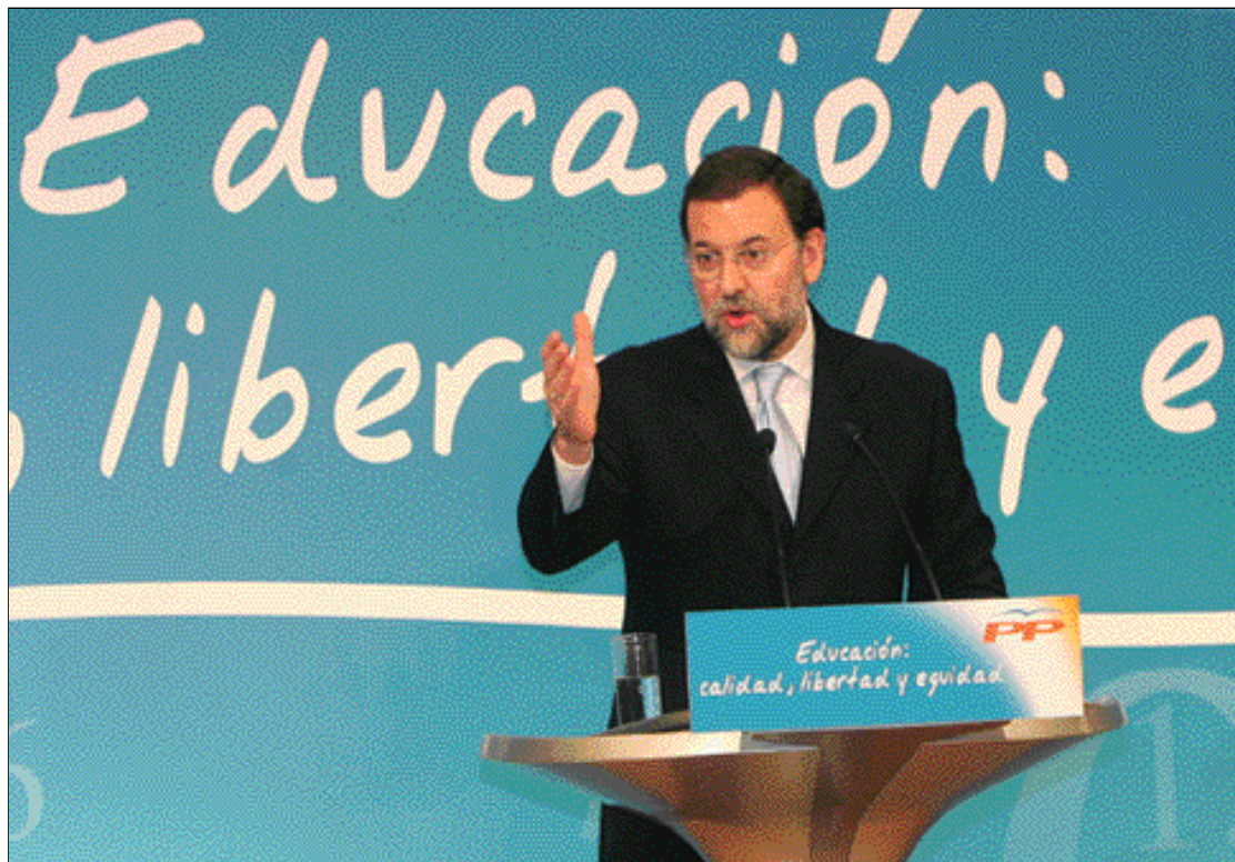
Rajoy afirmó que es indispensable mejorar la calidad de la enseñanza

Los más de cincuenta mil alumnos que ya este curso podían haber accedido a los programas de iniciación profesional y tener una vía formativa que les podía conducir a un título, además de a una cualificación profesional, se han quedado fue-