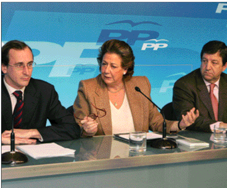
Los alcaldes de Vitoria, Valencia y Villanueva de la Cañada