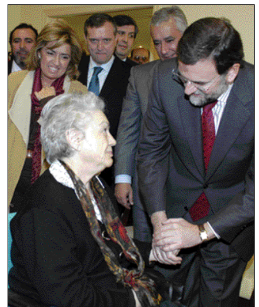
Mariano Rajoy, en Córdoba