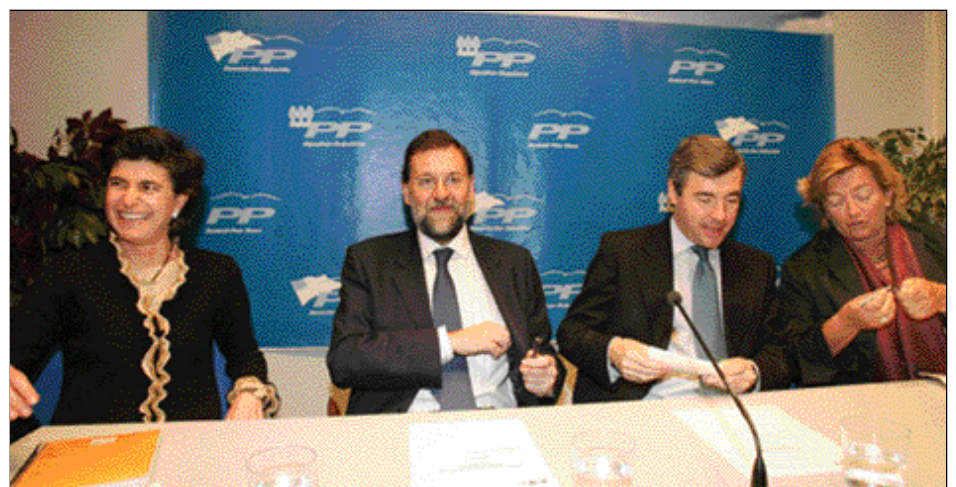
Reunión del Comité Ejecutivo del PP de Guipúzcoa