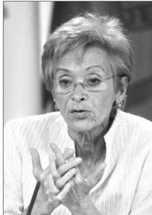
Teresa Fernández de la Vega