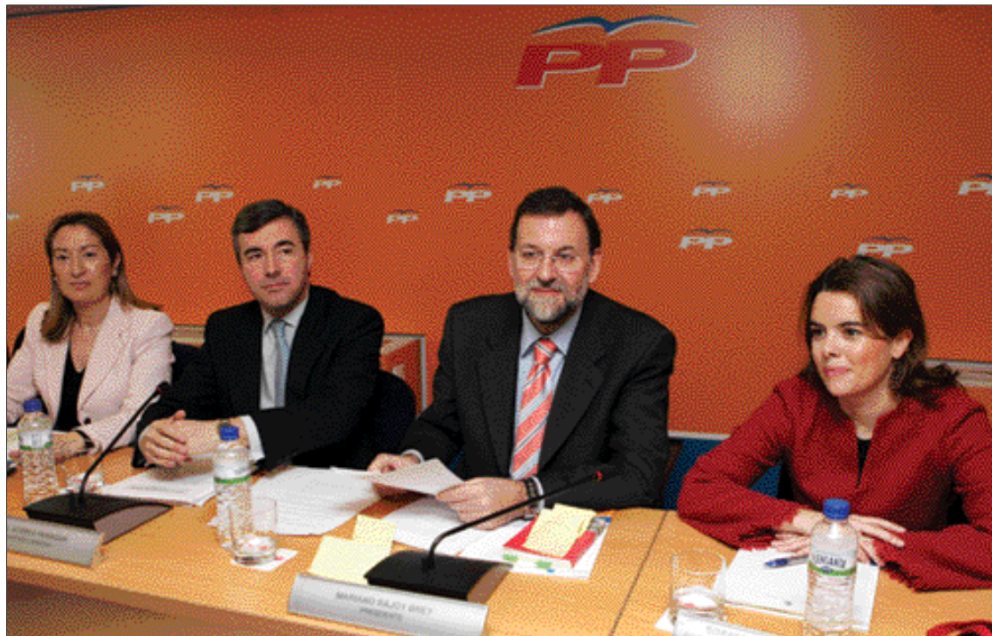
Los dirigentes del PP, en el último Comité Ejecutivo Nacional

No contemplamos una amenaza banal, sino el mayor desafío que ha sufrido la democracia española desde 1978. Un desafío a la democracia que se perpetra desde las instituciones de la democracia. Una in-