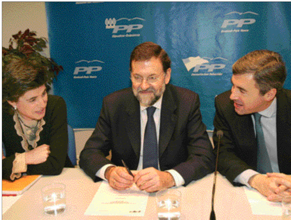
María San Gil, junto a Mariano Rajoy y Ángel Acebes

Rajoy ha apuntado que al PP le preocupa la unidad, la soberanía nacional, el modelo de estado, la igualdad y la solidaridad entre los españoles; así como la legalidad y el cumplimiento de las reglas de juego. "En España han pasado cosas que han generado mucha inquietud, se ha abierto un proceso de reformas que no se ha concretado y en el que no se sabe qué es lo que se pretende. El PP representa al 38% de los españoles, por lo que hay temas que deben ser producto de reflexión y de acuerdo entre los dos partidos que re-