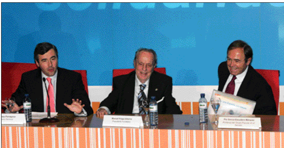
La Interparlamentaria Popular se celebró en Pontevedra