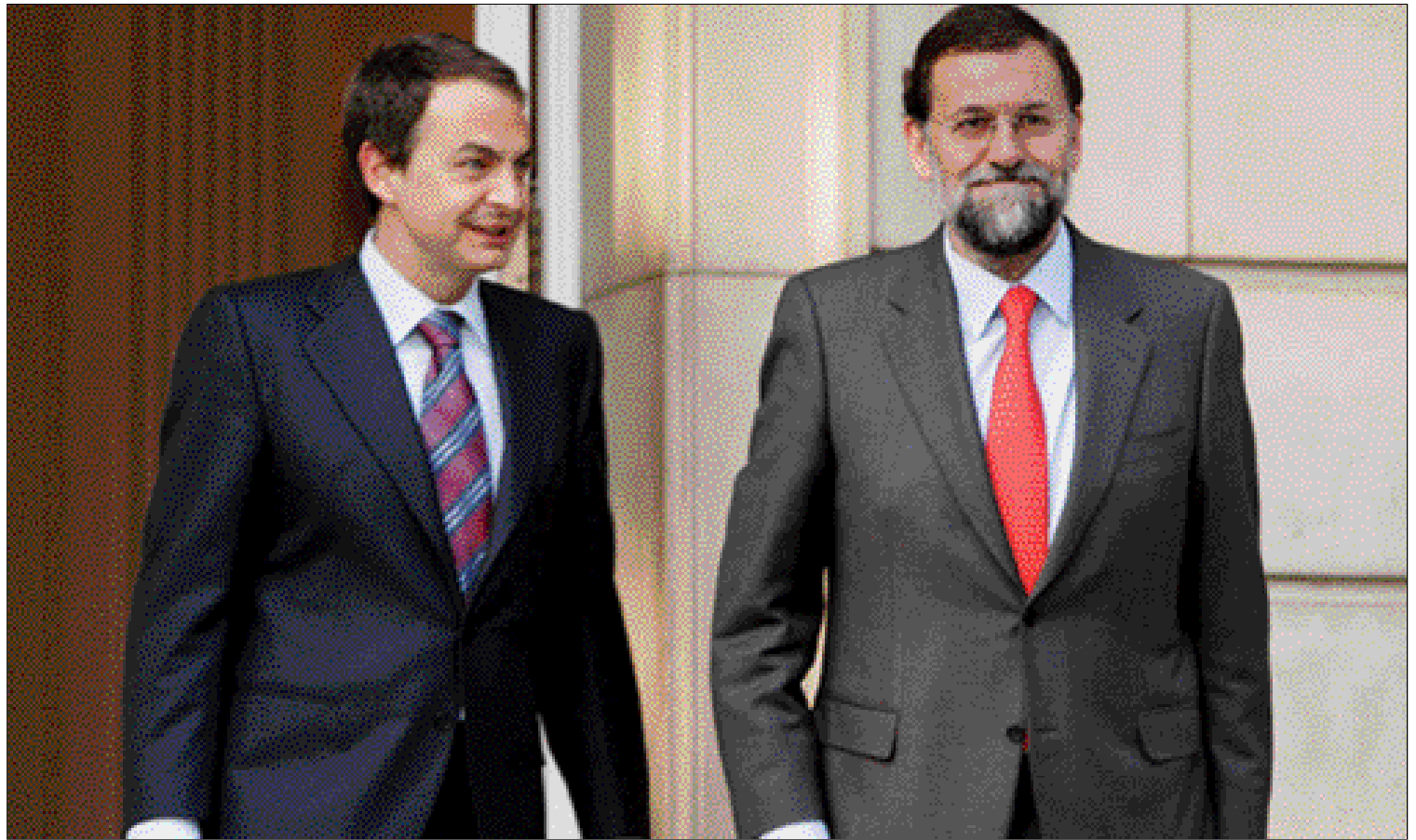
Zapatero y Rajoy, en la Moncloa antes del comienzo de la reunión

Este proceso ha permitido acceder a unos niveles de autogobierno que colocan a España entre los países del mundo más descentralizados. Esta autonomía no sólo se manifiesta en el porcentaje de gastos e