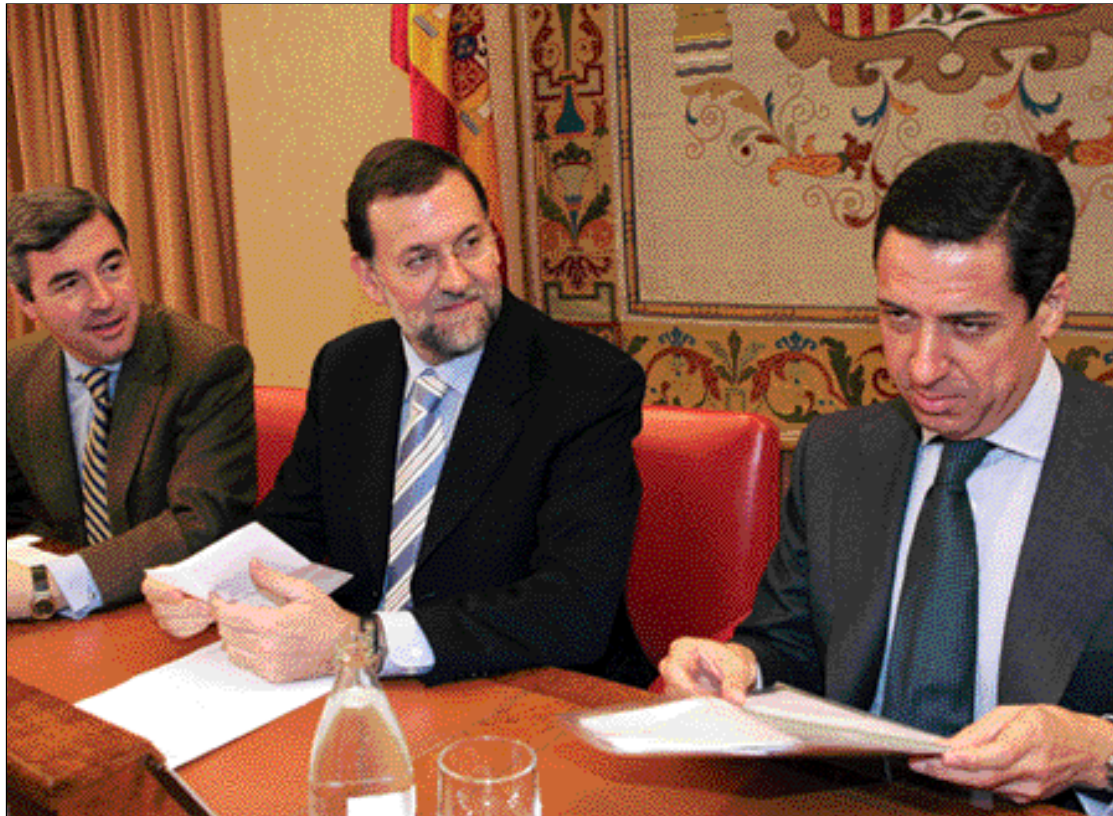
Un momento de la reunión del Grupo Parlamentario Popular

Además, TVE también encontró en la edición del telediario unos segundos para que el ministro de Trabajo, Jesús Caldera, se explicara sobre los certificados de antecedentes penales de los inmigrantes ecuatorianos. Y por último, dedicaron unos segundos a promocionar la entrevista que unos minutos después realizó Lorenzo Milá y cuatro pe-