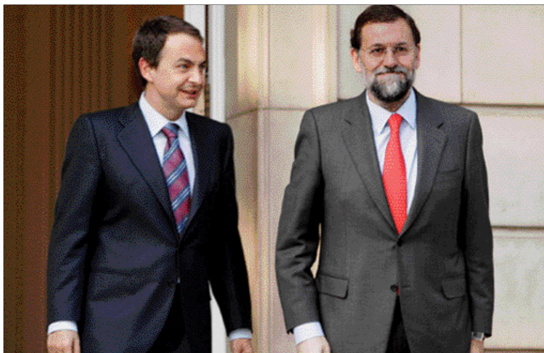
El presidente del Gobierno y Mariano Rajoy, en su reunión en La Moncloa

Aclaró también que esta oferta de ayuda no supone una renuncia a sus principios ni a hacer oposición. “Vamos a mantener nuestros principios y nuestras convicciones. Podemos mantener la oposición en aquellos temas en que creamos que tenemos que mantener la oposición, como es natural, porque todavía no está concretado el diálogo. Lo que hay es una oferta de ayuda”, manifestó. El presidente del PP explicó los motivos que le llevaron a hacer esta oferta: la “inquietud y preocupación” en la sociedad española por la aprobación del Plan Ibarretxe, las reformas constitucionales y estatutarias “aún no concretadas” y la “debilidad” del Gobierno socialista. Pág 4-7