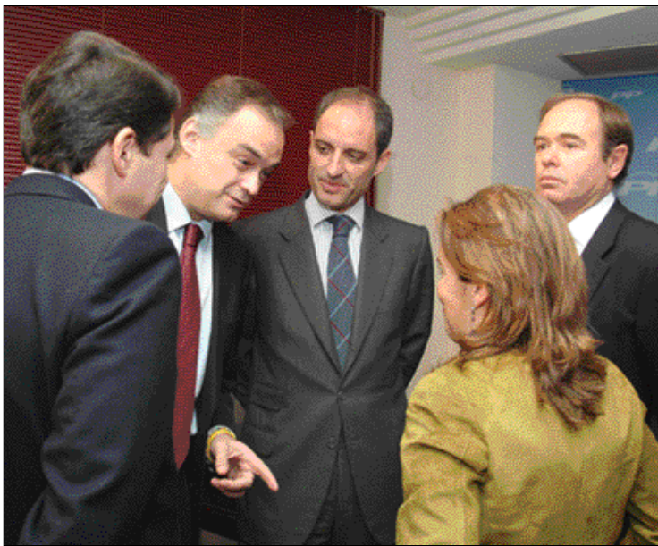
Dirigentes del PP en una reunión en Valencia