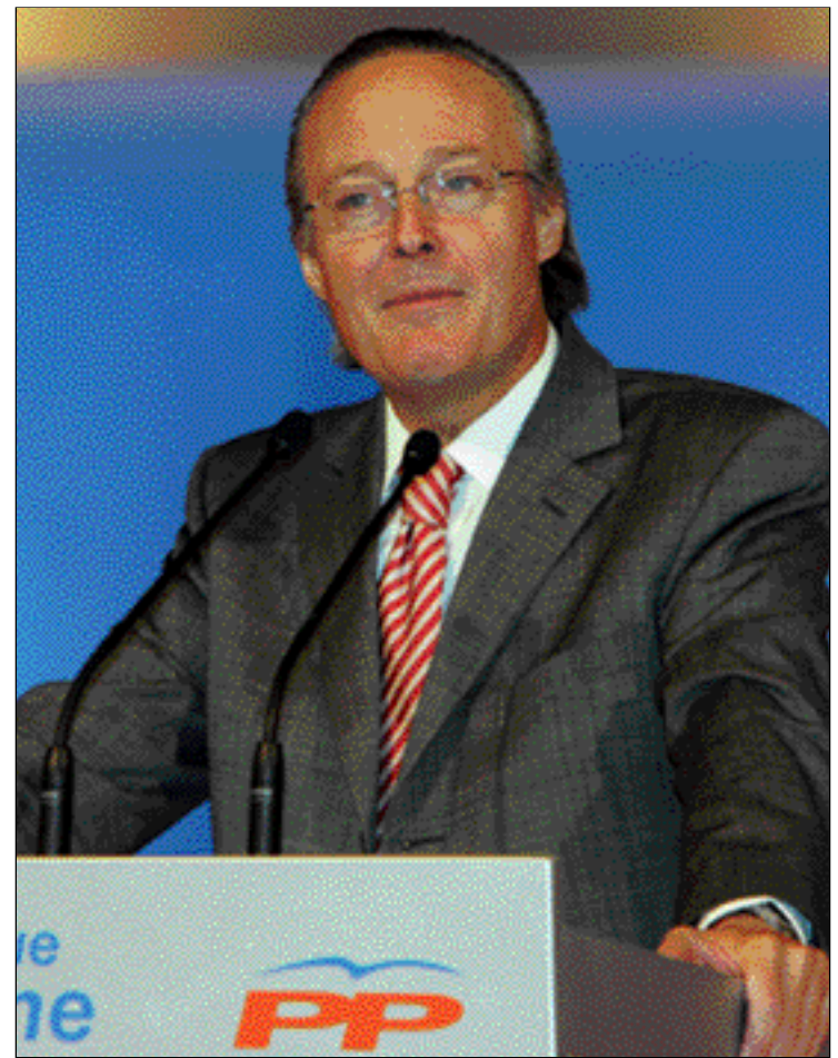
Josep Piqué, presidente del PP de Cataluña

Siempre me he llevado bien y si go llevándome bien. Las relaciones personales siempre tienen que estar por encima de diferencias políticas, pero es que tampoco son de fondo. Yo evidentemente estuve en Sigüenza, pero era una más de las 10 personas que estábamos allí reunidas y lo que observé fue una gran coincidencia de criterios y una gran unanimidad respecto a lo que después se concretó el pasado viernes, respecto a la oferta de pacto, de acuerdo, para salvaguardar el consenso constitucional a hacer al Pre-