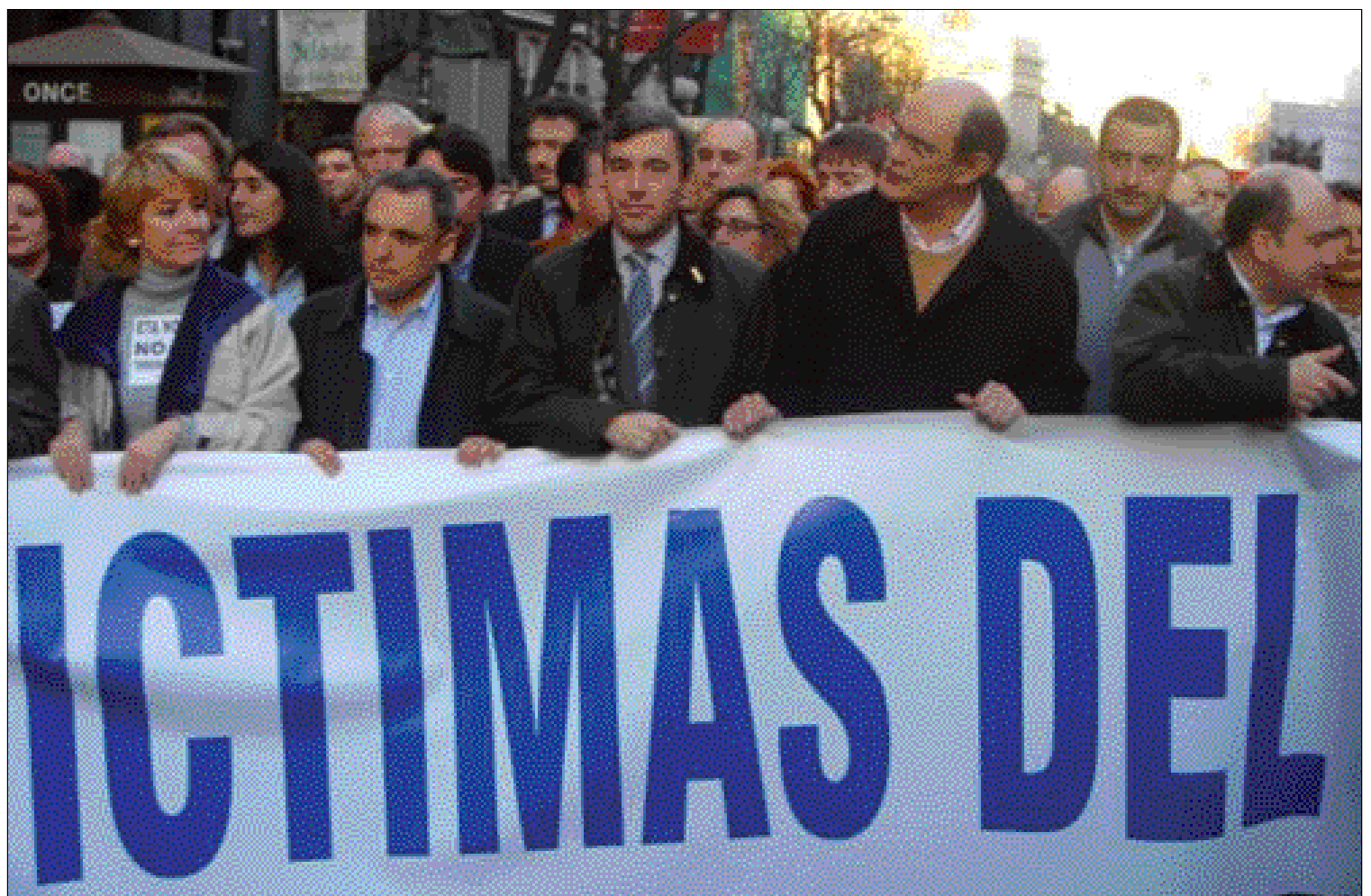
Los dirigentes del PP, en la manifestación a favor de las víctimas del terrorismo

Si es cierto que cuando salta la noticia y empieza a propagarse el escándalo el cesado recibe una llamada de un alto responsable policial que contradice la primera orden y le dice que al día siguiente debe reincorporarse al trabajo.