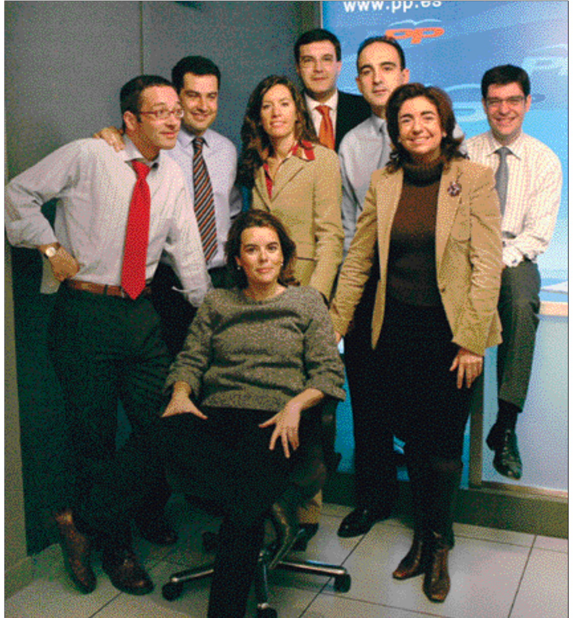
Algunos miembros de la nueva dirección del PP