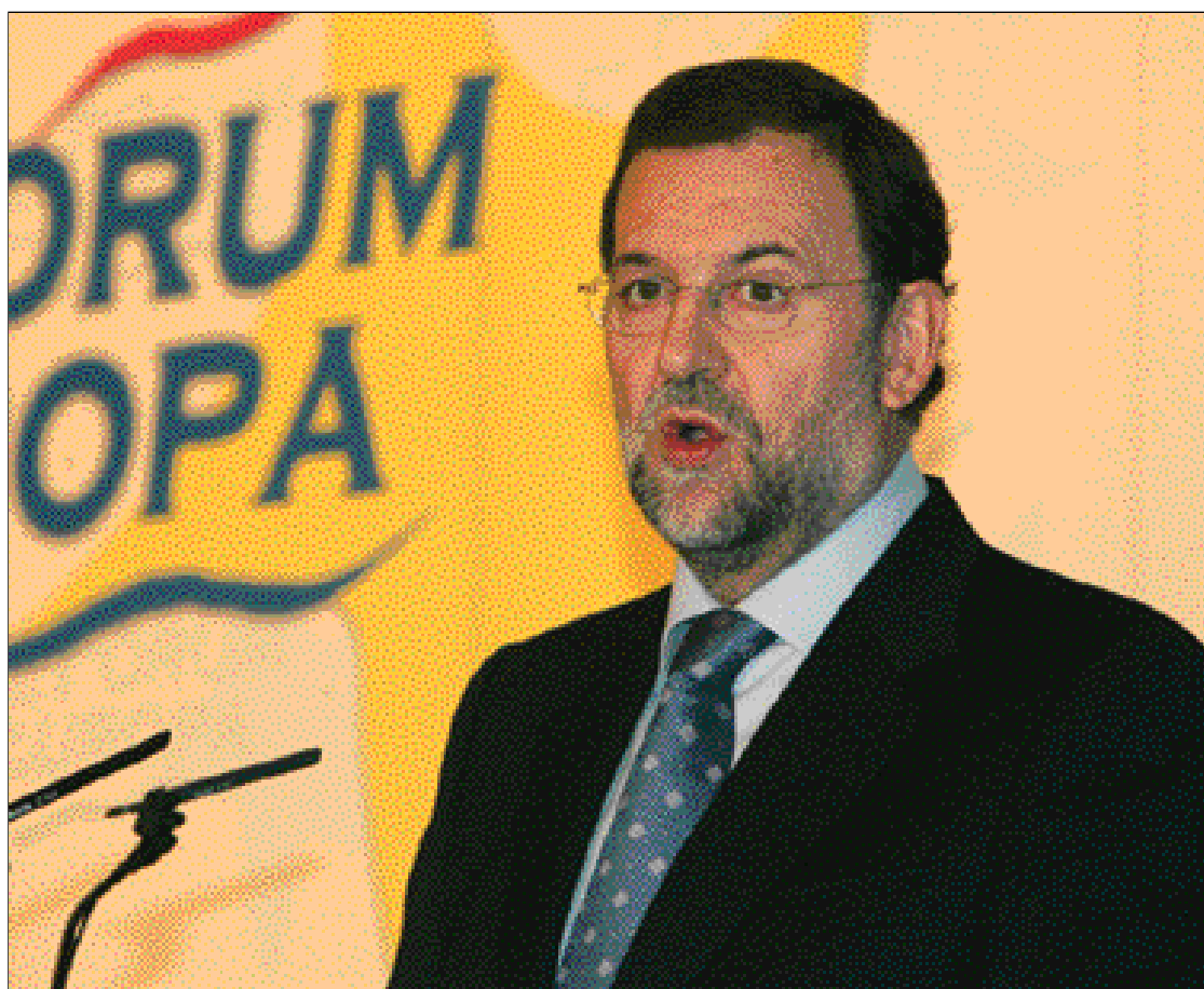
Mariano Rajoy afirmó que ETA se encuentra mucho más débil

En este sentido, el presidente popular ha subrayado que acudió a la reunión de Moncloa a manifestar su inquietud y la de muchos españoles por lo que está sucediendo y a ofrecer ayuda a cambio de nada "y no a plantear un contrato de adhesión".