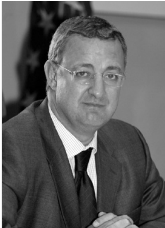
Jesús Caldera, ministro de Trabajo