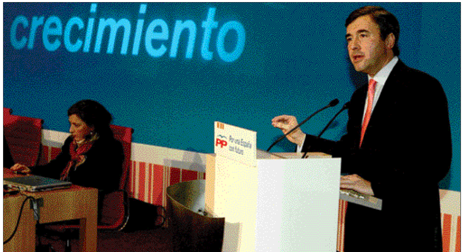
El secretario general del PP, en su intervención en la Interparlamentaria Popular celebrada en Pontevedra

Por otra parte, Acebes ha recordado que desde el PP se instó al Ejecutivo de Rodríguez Zapatero a que defendiese el prestigio y la honorabilidad del Gobierno del PP tras las declaraciones del rey de Marruecos, Mohammed VI, y que su repuesta