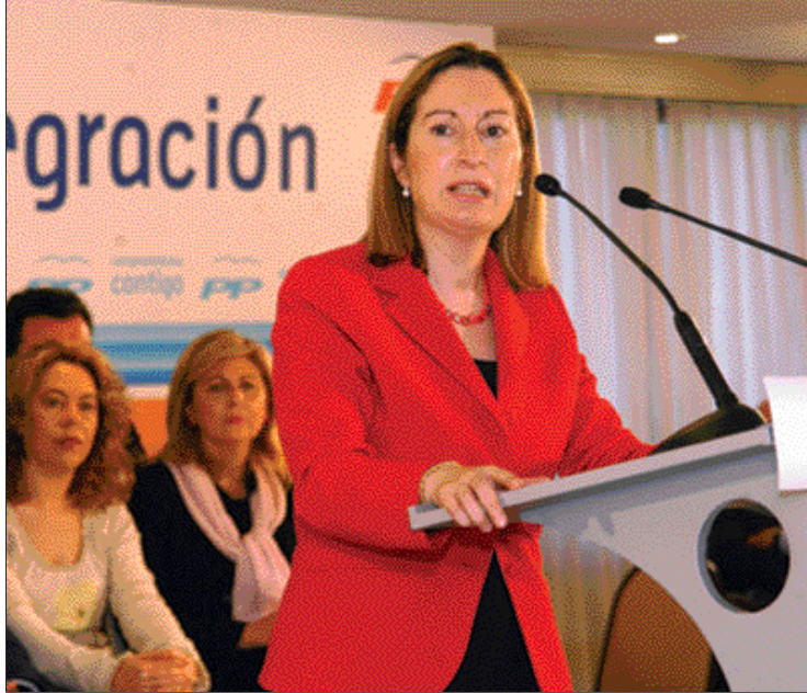
Ana Pastor, secretaria ejecutiva de Política Social del PP

La secretaria ejecutiva de Política Social y Bienestar del Partido Popular, Ana Pastor, ha reclamado en Logroño una mayor atención para la profesión sanitaria. Pastor ha recordado que el Grupo Parlamentario Popular ya presentó con ocasión de los Presupuestos Generales del Estado propuestas para hacer frente a los gastos con ocasión de la puesta en marcha de dicha carrera profesional. Además, ha reiterado que el GPP tiene previsto instar al Gobierno a que haga posible la aplicación de la Ley de Ordenación de las Profesiones Sanitarias (LOPS).