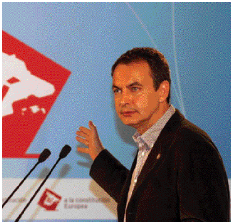
Zapatero tampoco anda fino en Europa

Para Miguel Arias, la propuesta de la Comisión Europea implica un reparto desigual de los costes de la ampliación de la UE y España se convierte en el gran pagador de este proceso, por lo que dicha propuesta necesita mejoras sustanciales y específicas. "Esto significa que nuestro país dejará de ser beneficiaria de las políticas de cohesión", con el beneplácito del presidente Zapatero. "Los riesgos son evidentes y la debilidad negociadora es patente", ha añadido.