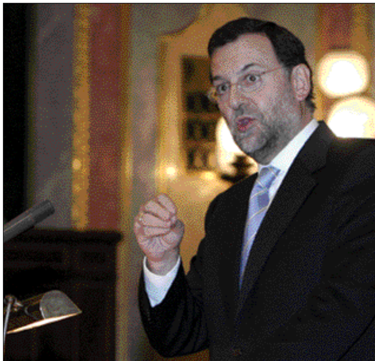
Rajoy, en una intervención en el Parlamento

Rajoy consideró necesario obtener "cuanto antes" el reconocimiento de la especial situación española y la necesidad de alcanzar una solución específica para ella. "Nunca en la historia de la Unión se han revisado las políticas comunitarias a cos-