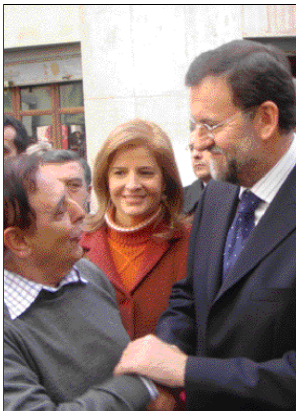
El presidente del PP, con simpatizantes de Málaga