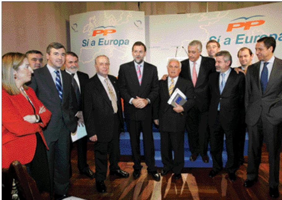
En Santiago de Compostela se celebró el último Ejecutivo del PP