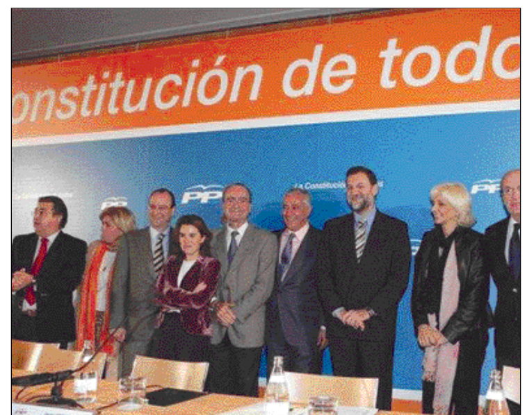
Rajoy, con los dirigentes del PP de Andalucía

Rajoy ha dejado clara la postura del Partido Popular respecto a este proceso y, por ello, ha asegu-