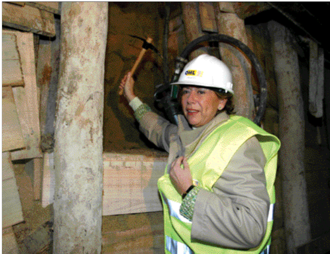
Magdalena Álvarez, ministra de Fomento

El actual diputado por Cantabria y portavoz en el Congreso de los socialistas, Alfredo Pérez Rubalcaba, decía el 29 de febrero pasa-