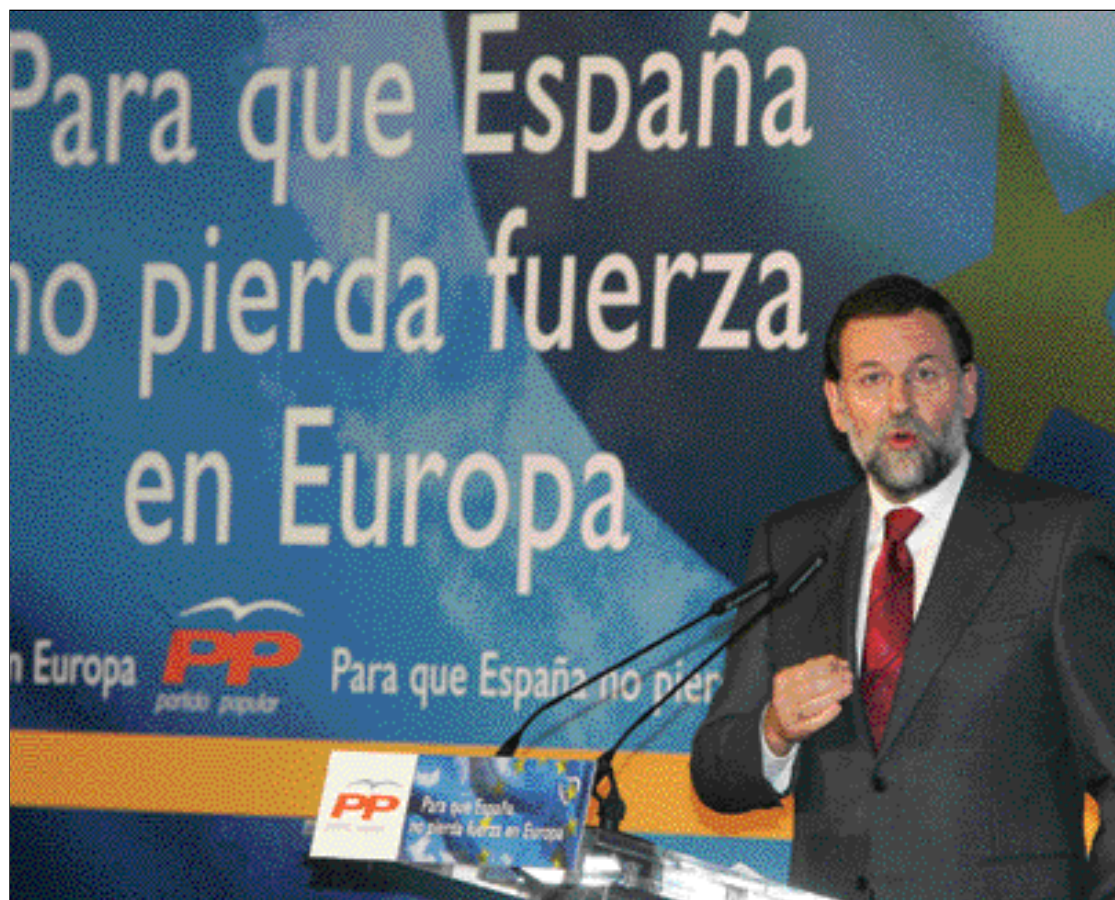
Rajoy ha dicho que el PP contribuirá para conseguir un sí mayoritario al texto constitucional

Ante esta situación, el Partido Popular cree que es imprescindible ob-