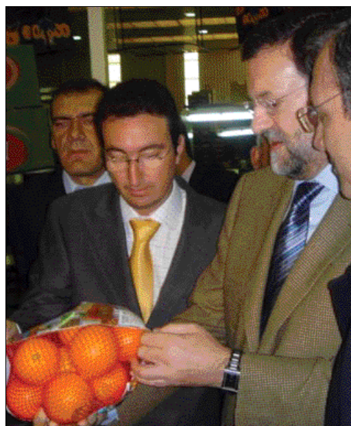
Naranjas de Lepe para el líder del PP