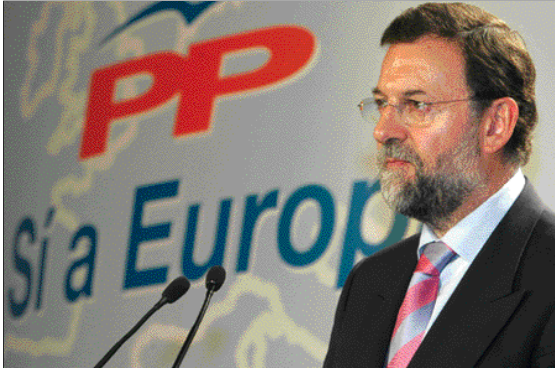
El presidente del PP criticó la dejadez del Gobierno en el referéndum sobre la Constitución europea

“No es momento para personas sin determinación, sino para aquellos que dicen las cosas con claridad”