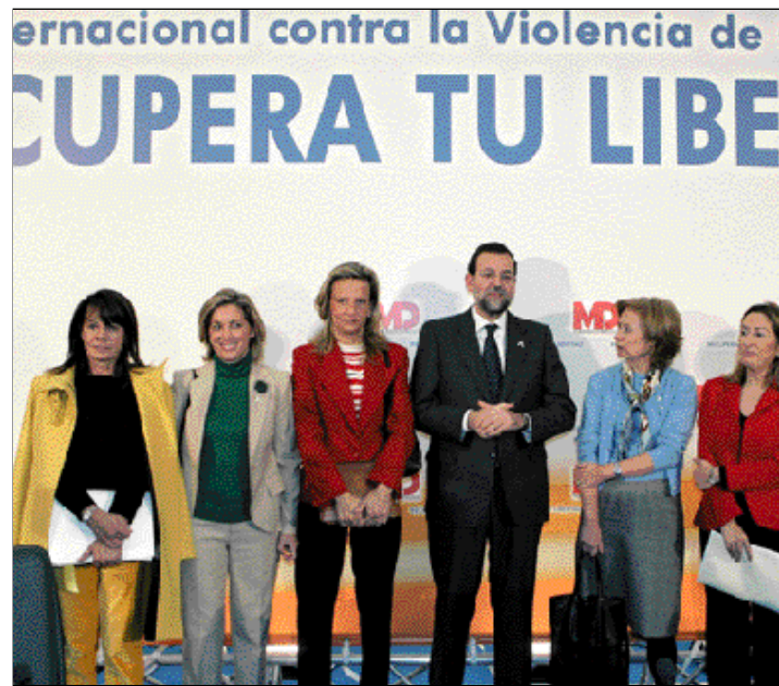
Rajoy, con participantes del Foro sobre Violencia de Género

Gracias a estos planes, ha añadido Rajoy, las víctimas cuentan con más y mejores servicios de atención y apoyo; tienen mayor protección jurídica y física; y la Justicia es más ágil, más eficaz y más severa con las conductas delictivas.