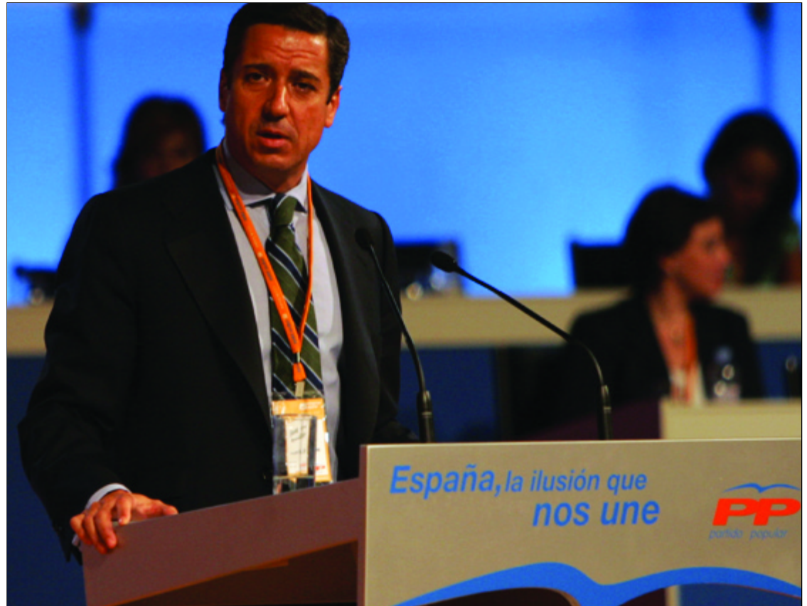
El portavoz del PP en el Congreso, durante una intervención pública reciente

3. Enmienda 1642 (PSOE, CC): aumentar en 3 millones de euros la dotación de las subvenciones al