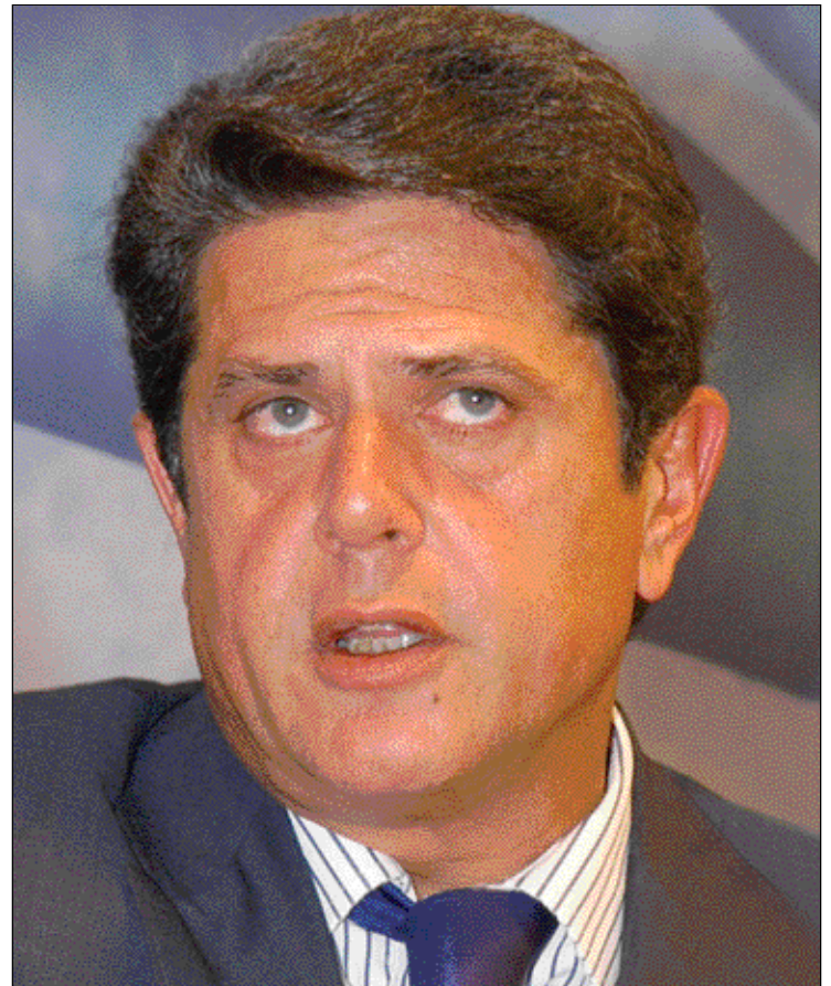
Federico Trillo, ex-ministro de Defensa

Sí. El Presidente me llamó porque sabía que esa iba a ser mi actitud para pedirme que no lo hiciera porque sabía que yo no tenía ninguna responsabilidad y que había sido condenado por muchos de aquellos familiares antes de que siquiera empezáramos a averiguar las causas de lo que luego resultó ser un accidente por un fallo humano de los pilotos. No hay quien lo saque de ahí. Segundo, yo di cuentas ante mi propio partido. Tercero, yo fui a las elecciones,