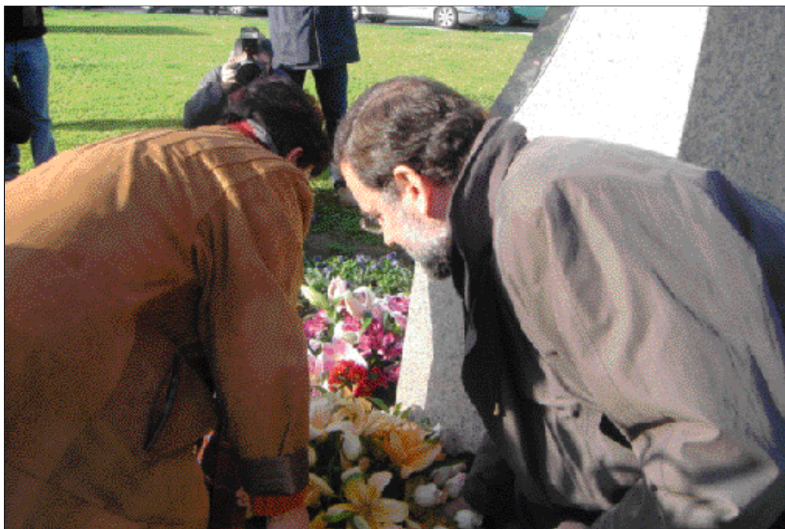
El Presidente del PP, en Irún, en el acto de homenaje a los concejales asesinados por ETA

Rajoy ha censurado que el Partido Socialista del País Vasco se haya apartado de la defensa del Estatuto con tal de compartir el poder y ha asegurado que el verdadero obstáculo contra el Plan Ibarretxe son los propios ciudadanos, que rechazan lo que consideran un “atropello”, al tiempo que ha animado a los presentes a seguir luchando en defensa de la libertad de todos los vascos. “El obstáculo está en los ciudadanos. Son ellos quienes rechazan lo que algunos