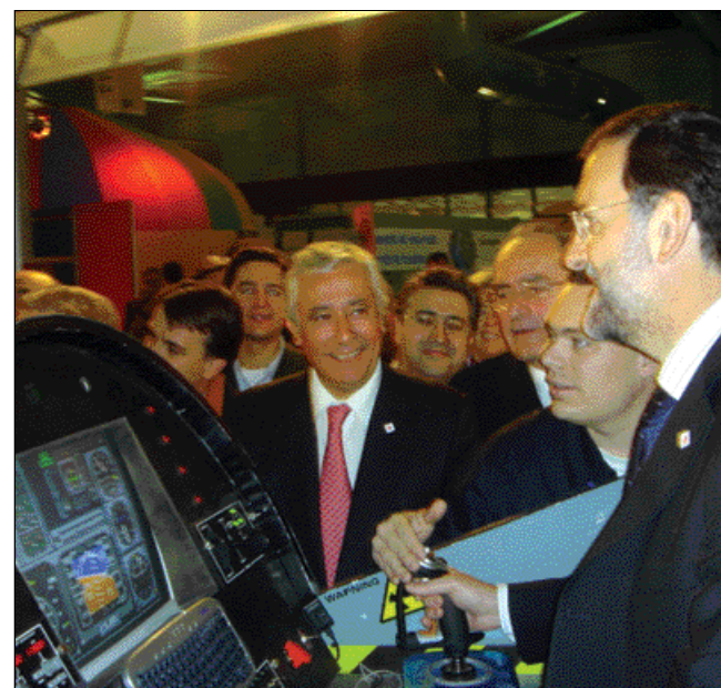
Rajoy hace sus prácticas en un simulador de vuelo