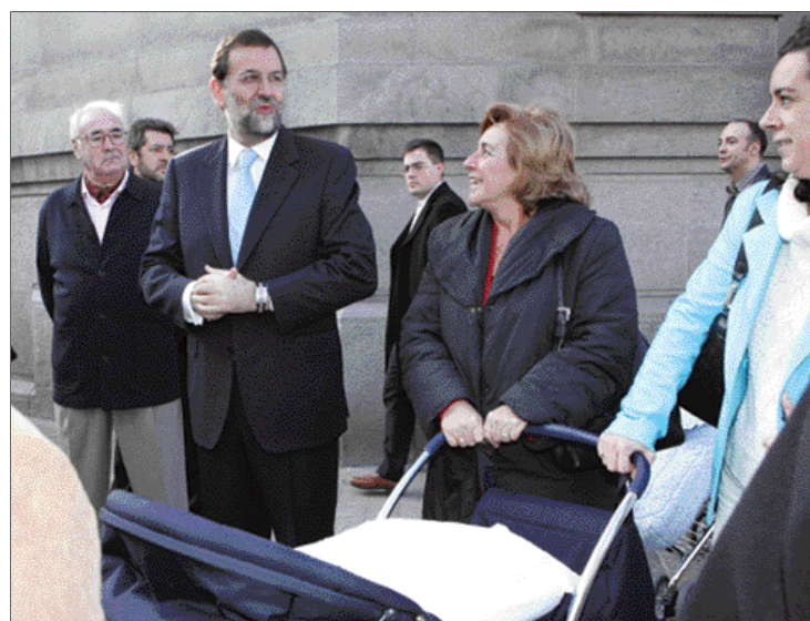
■ Rajoy paseando por Bilbao, donde asistió a diversos actos

Preguntado por las declaraciones de la presidenta de Eusko Alkarta-