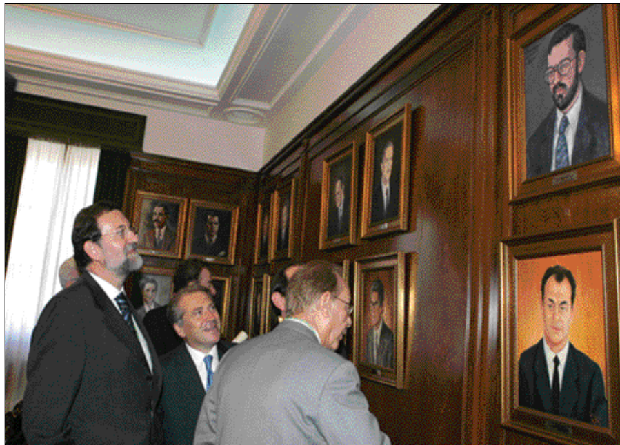
Mariano Rajoy contempla su retrato en la Diputación de Pontevedra