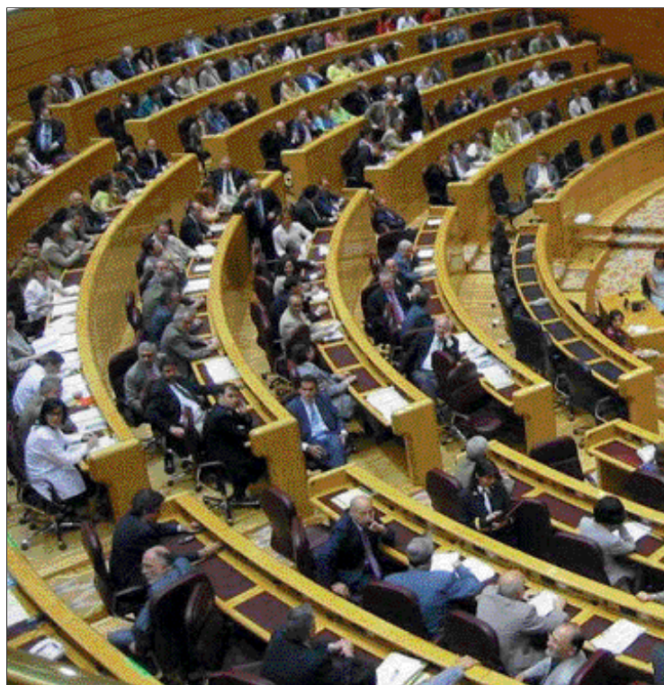
El PP denuncia la falta de respeto del Gobierno al Senado

previsiones de crecimiento de los ingresos “están infladas” y el aumento previsto de los gastos, superior al 6%, “acaba con la sana moderación de los últimos ejercicios”, con subidas que rondaban el 4%, y añade más tensión aún a los precios.