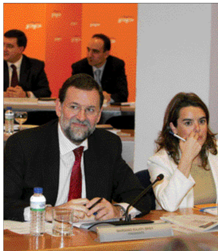
Rajoy, junto a Soraya S. de SantaMaría, en la última Ejecutiva del PP

Asimismo, Rajoy ha recordado que desde el principio advirtió "que las conclusiones estaban es-