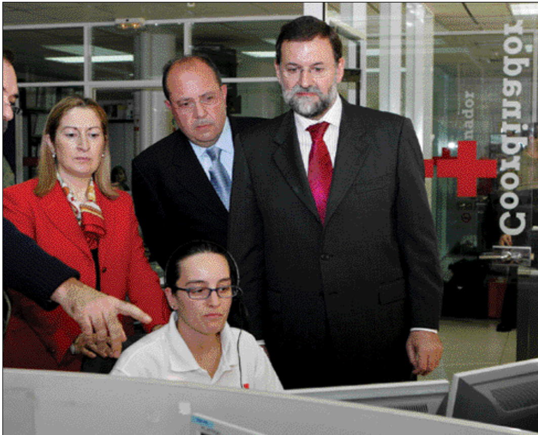
Ana Pastor y Mariano Rajoy, en un encuentro con responsables de Cruz Roja

Valoración del PP del Consejo Interterritorial de Sanidad