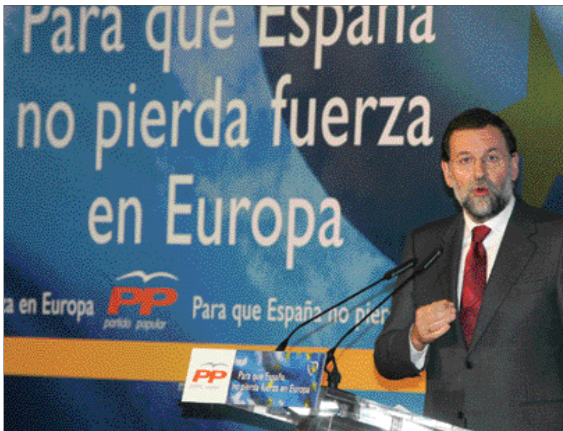
Mariano Rajoy asegura que el PP no dará la espalda a los ciudadanos

Para el líder del PP "España es una nación, lo diga o no el presidente del Gobierno. No hay mas naciones, sino nacionalidades y regiones". Por ello, ha abogado por la defensa de la igualdad de derechos, deberes y oportunidades de todos los españoles y la solidaridad como principio básico de actuación de las