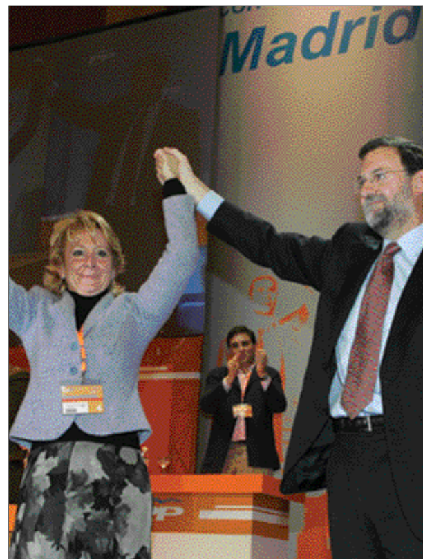
Esperanza Aguirre, presidenta del PP de Madrid