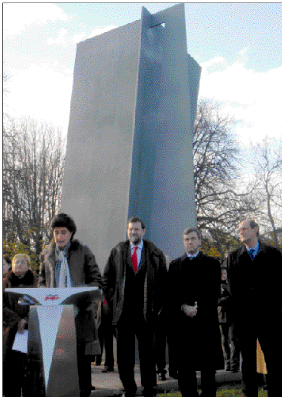
Acto en Irún de homenaje a víctimas de ETA