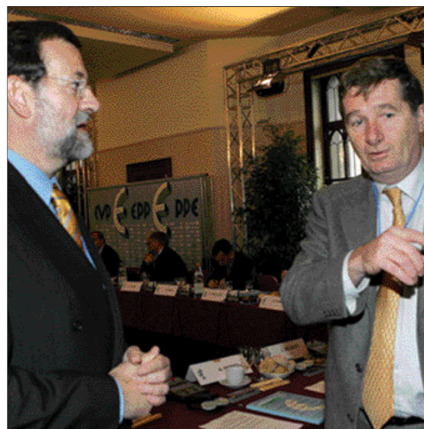
En Bruselas, con el Vicepresidente del PPE