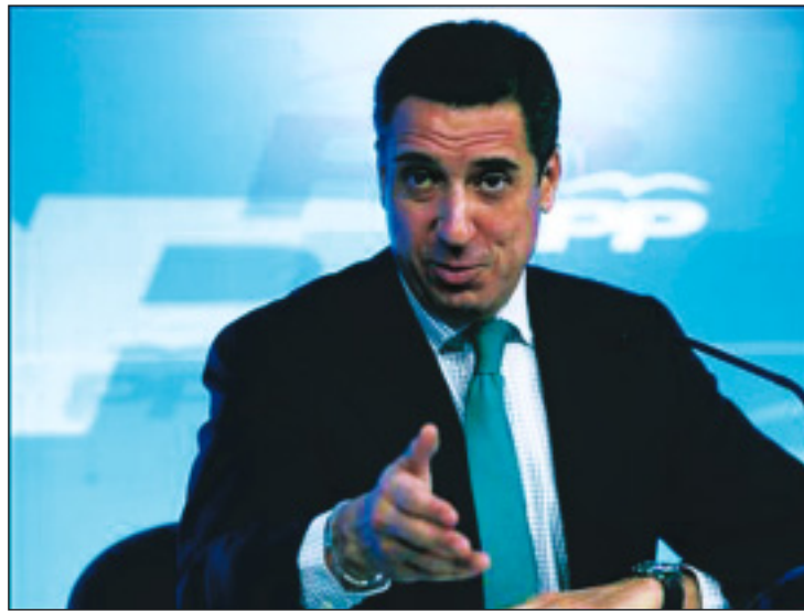
Eduardo Zaplana, en el transcurso de una rueda de prensa

Por otro lado, preguntado por cuándo va a presentar el PP el recurso de amparo ante el Tribunal Constitucional por la tramitación del Estatuto de Cataluña, el portavoz popular ironizó con el "interés exagerado" que parece que le ha entrado al PSOE en los últimos días por este recurso