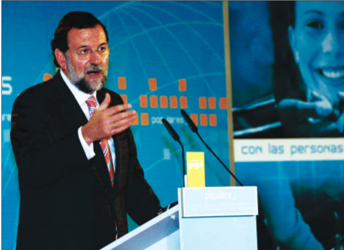
Rajoy destacó que en un país normal ni siquiera habría Ministerio de la Vivienda

Por otra parte, durante un acto con militantes y simpatizantes del PP en palma de Mallorca, el presidente del PP acusó a Rodríguez Zapatero de no ocuparse de la economía, de la mejora del bienestar y de la riqueza de los españoles, un hecho que según ha advertido evidencia que el presidente del Gobierno, en lugar de ocuparse de lo que realmente preocupa a los ciudadanos, crea problemas enormemente graves donde no los había. "Vive de la herencia y de la inercia, pero esto no dura toda la vida, sino que puede ser pan para hoy y hambre para mañana", ha añadido.