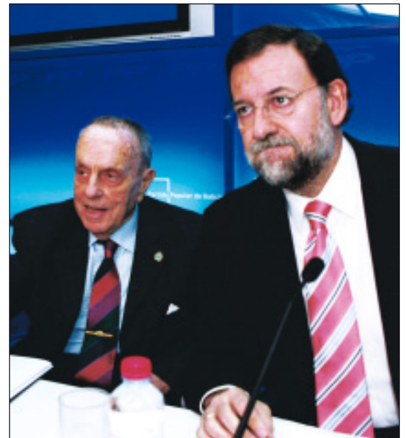
Fraga y Rajoy, en una reunión en Santiago