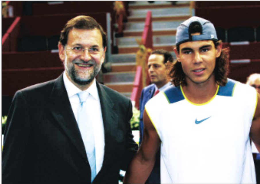
Mariano Rajoy, con el campeón Rafael Nadal