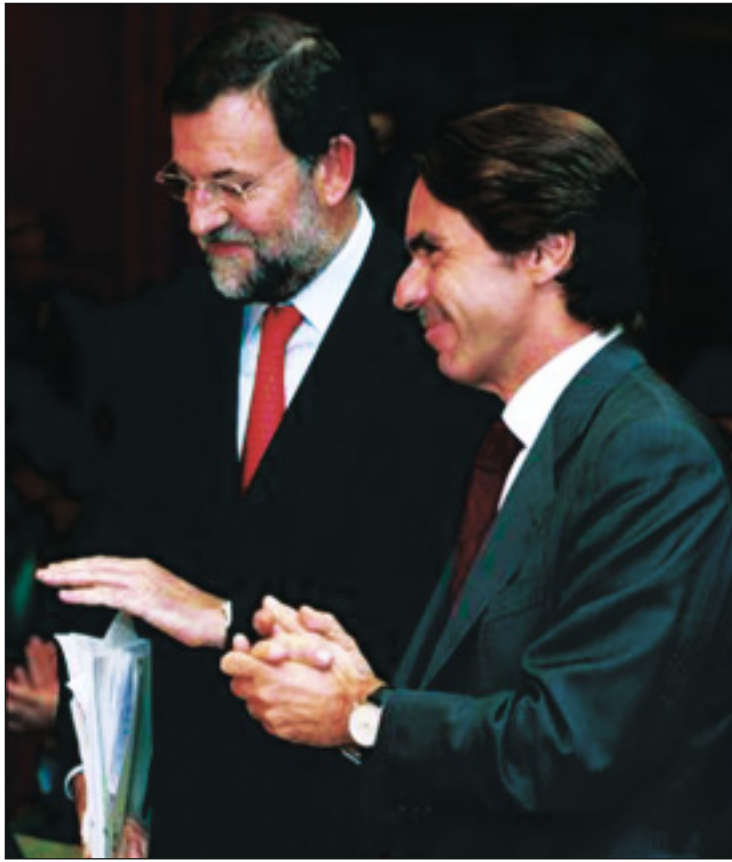
Mariano Rajoy y José María Aznar, en el acto de FAES

"Me gustaría hacerlo con el presidente del Gobierno español, con el Partido Socialista. Deberíamos coincidir, siempre lo hemos hecho. Algunas discrepancias ha habido, siempre menores, en lo que se refiere a España. Pero él no quiere", ha señalado el presidente del PP, quien no ha aceptado que "nadie, porque no tenga ningún otro argumento para defender aquello que ha hecho, se dedique a decir que los que no opinamos como ellos somos anticatalanes".