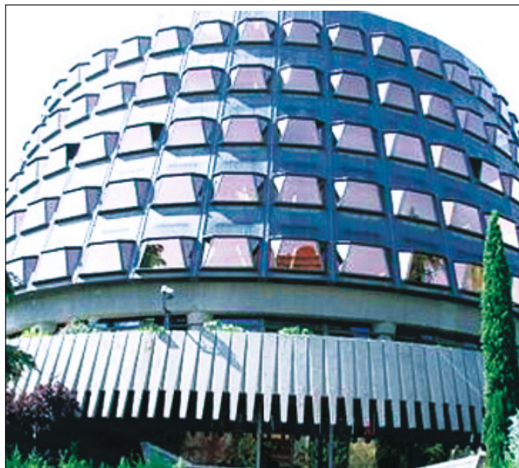
Sede del Tribunal Constitucional en Madrid

Junto a estos preceptos constitucionales, los diputados señalan tres razones añadidas que dan a la inconstitucionalidad de esta Ley “un relieve muy particular”. En primer lugar se refiere al carácter de “institución básica del matrimonio”, tal y como ha sido entendido hasta ahora, para nuestra organización social, que requiere y goza de una protección jurídica muy especial. En segundo lugar, la “imposibilidad de que el Legislador ordinario y no el constituyente modifique la Constitución utilizando el sencillo fraude de cambiar el nombre acuñado de las cosas y como tal utilizado por el constituyente”. Por último, la tercera razón añadida se refiere al hecho demostrable de que para “conseguir la finalidad legítima que el legislador persigue con esta reforma, nuestro ordenamiento ofrece fórmulas adecuadas sin necesidad de originar la