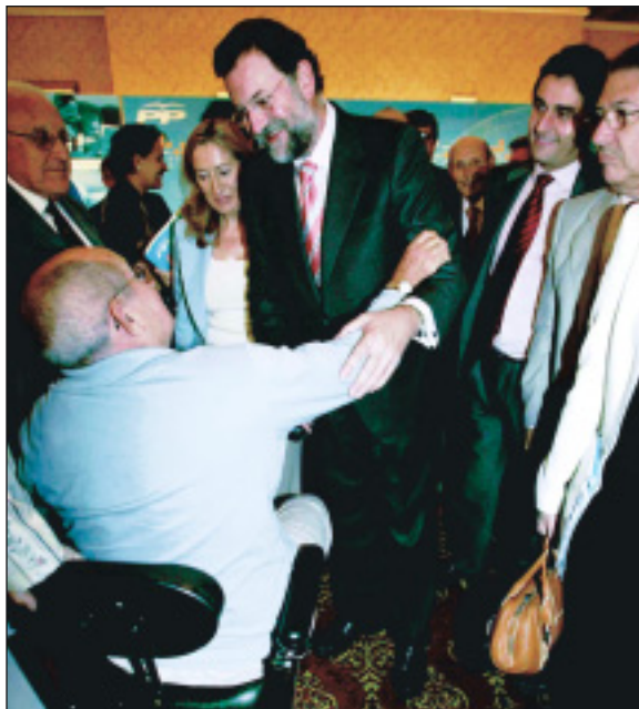
Rajoy, en un acto celebrado en Palma de Mallorca