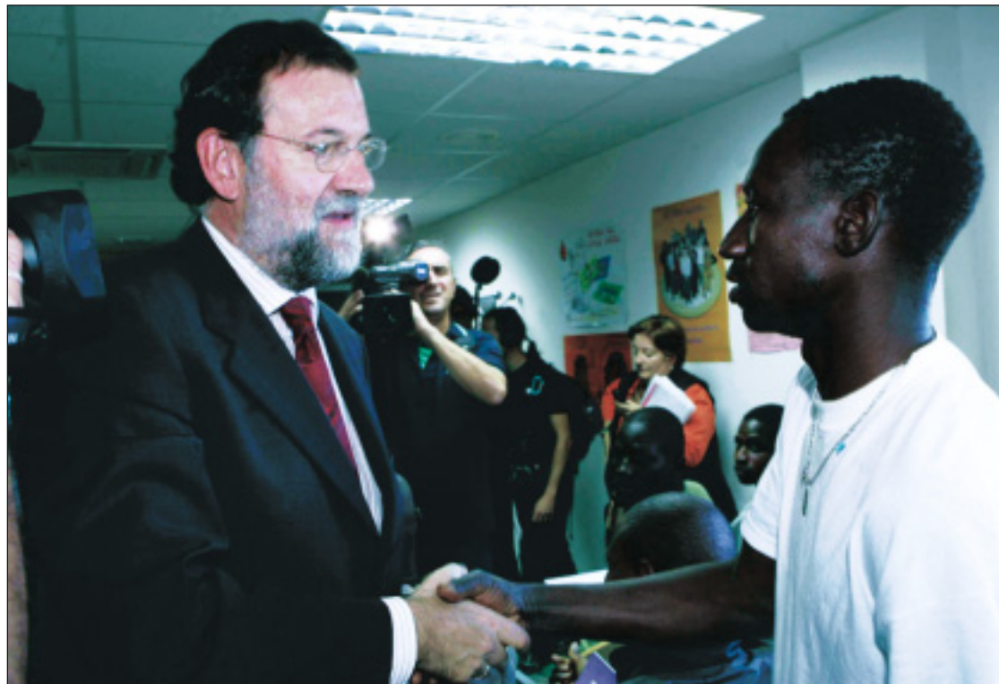
El presidente del PP visitó Ceuta y Melilla

Asimismo, Rajoy ha subrayado la necesidad de garantizar los derechos humanos y el trato justo a las personas que cruzan nuestras fronteras. Un asunto en el que, según ha añadido, deben “aplicarse” los Gobiernos de España y Marruecos, con objeto de evitar situaciones como las que se han vivido en los últimos días.