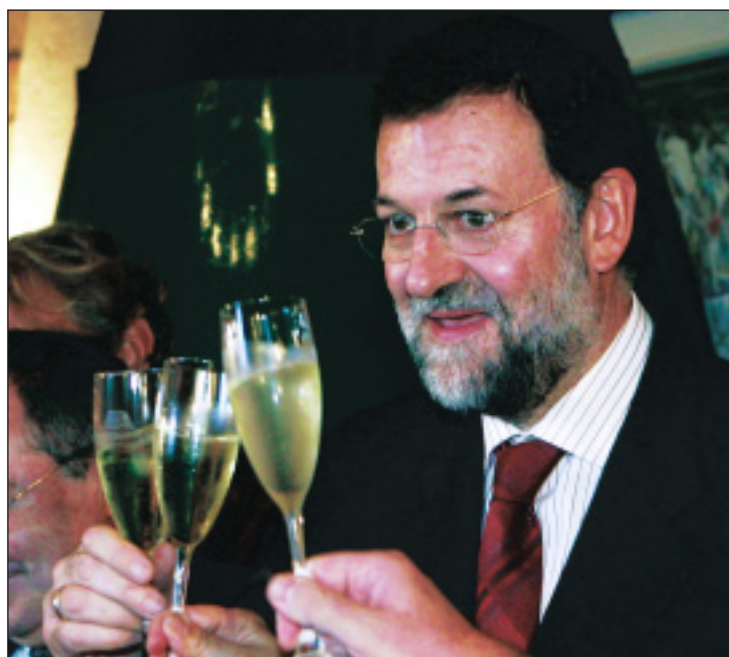
Mariano Rajoy expresó su apoyo a los empresarios del cava

faltado a su responsabilidad como presidente del Gobierno", ha añadido.