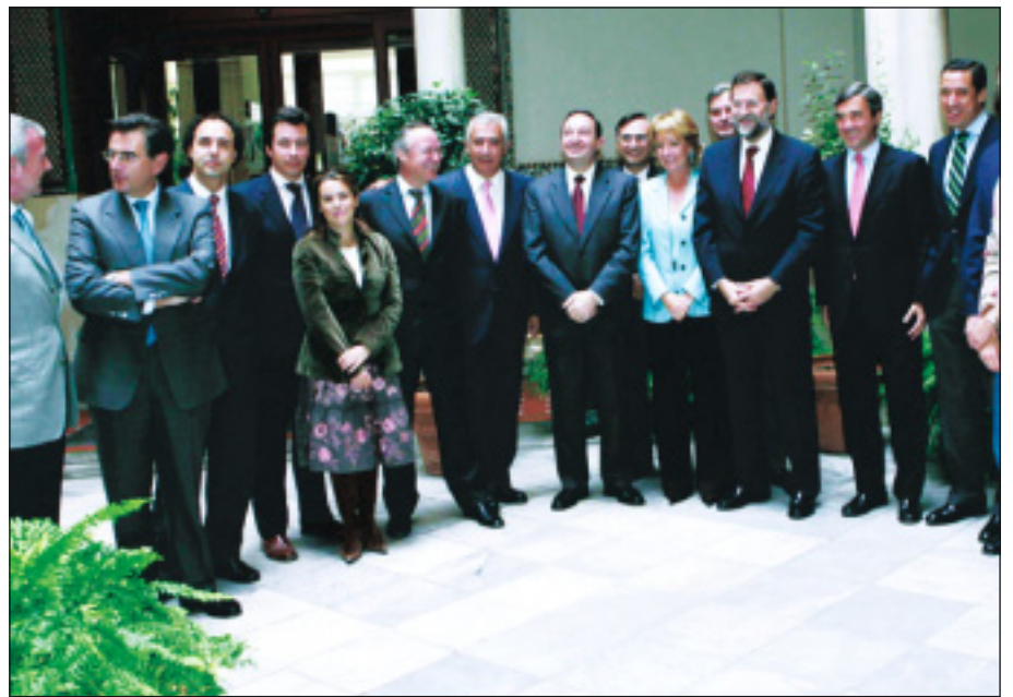
Reunión en Madrid de los presidentes regionales del PP