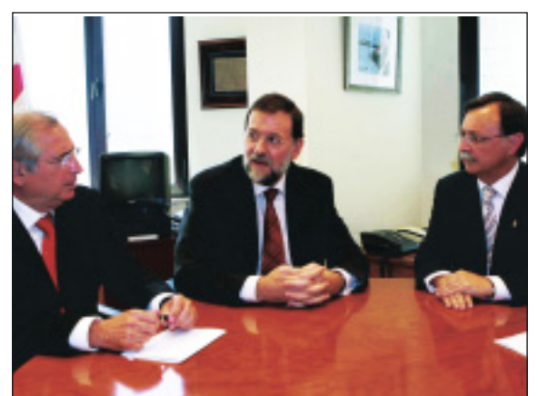
Reunión con los presidentes de Ceuta y Melilla