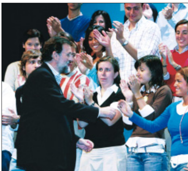
Los jóvenes del PP, siempre presentes en los actos