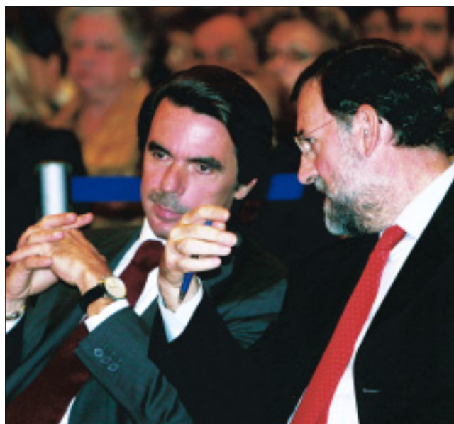
Aznar y Rajoy, en un acto de FAES